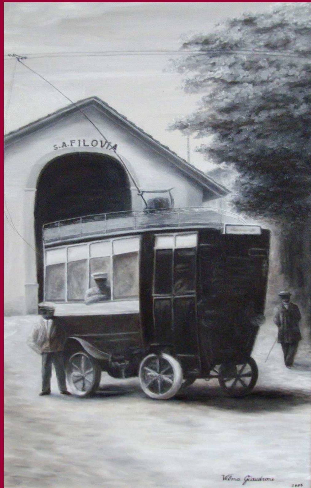
"FILOVIA olio su tela 30x60