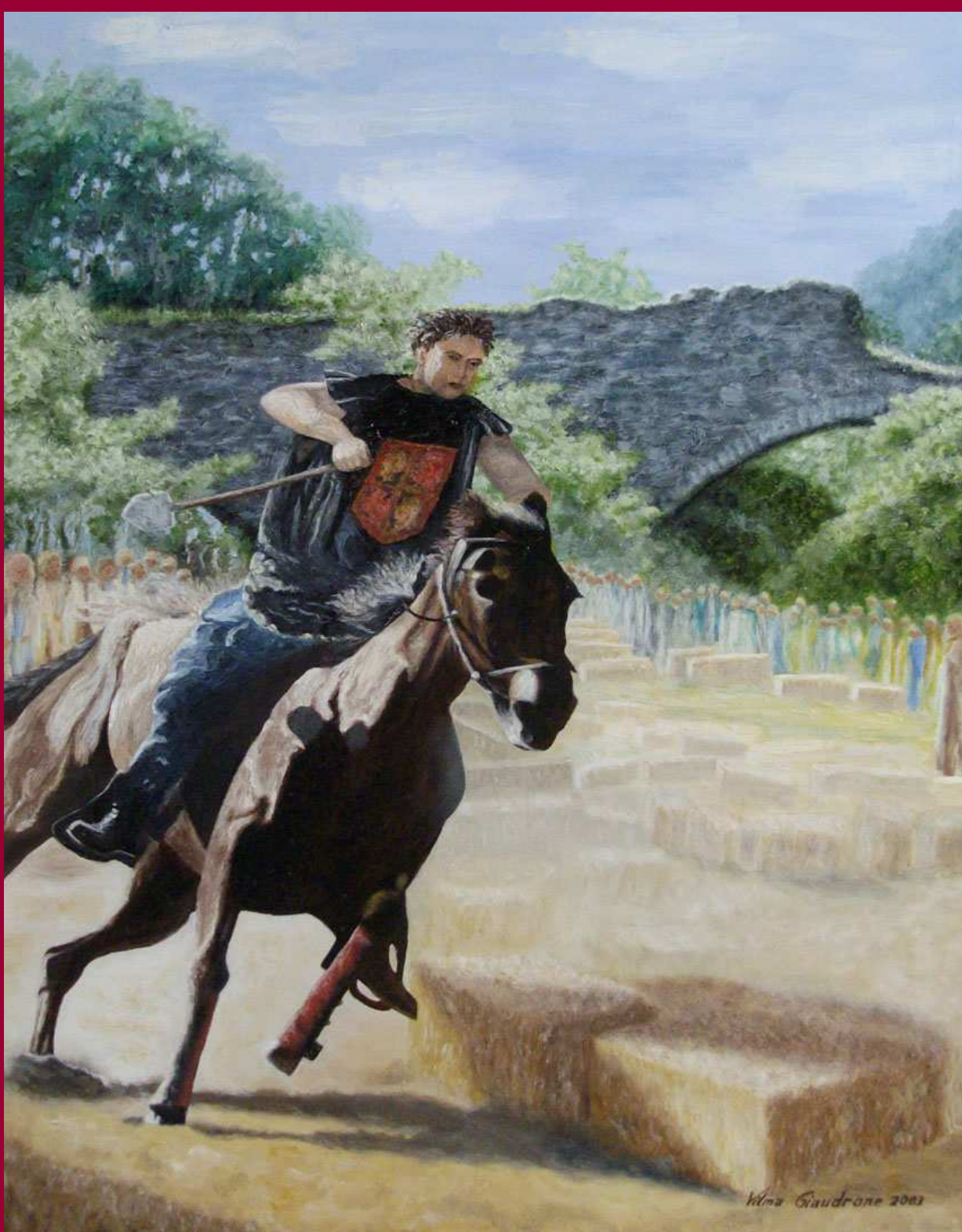
"TORNEO ALL'UNISONO" olio su tela 40x50