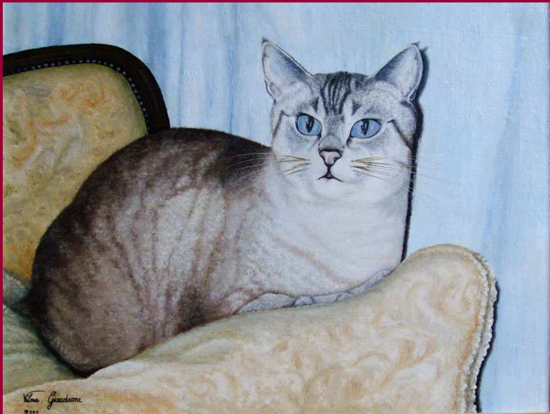
"NOBILTA' E AMORE" olio su tela 30x40