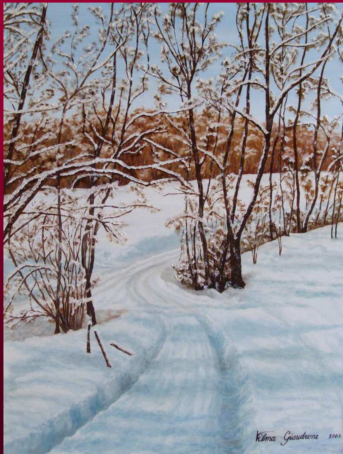
"CONTRASTI" olio su tela 35x45