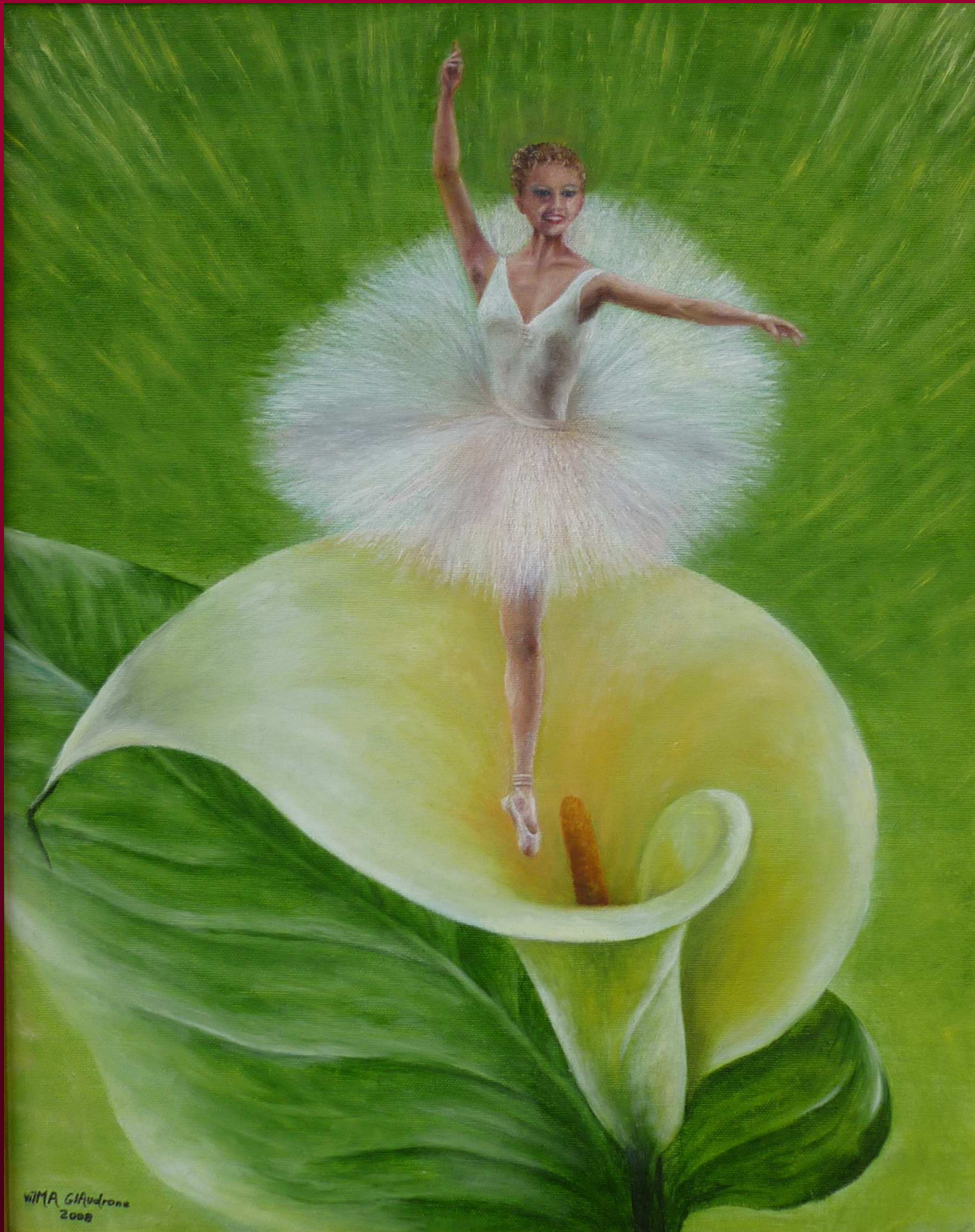
"PRODIGIO" olio su tela 40x50