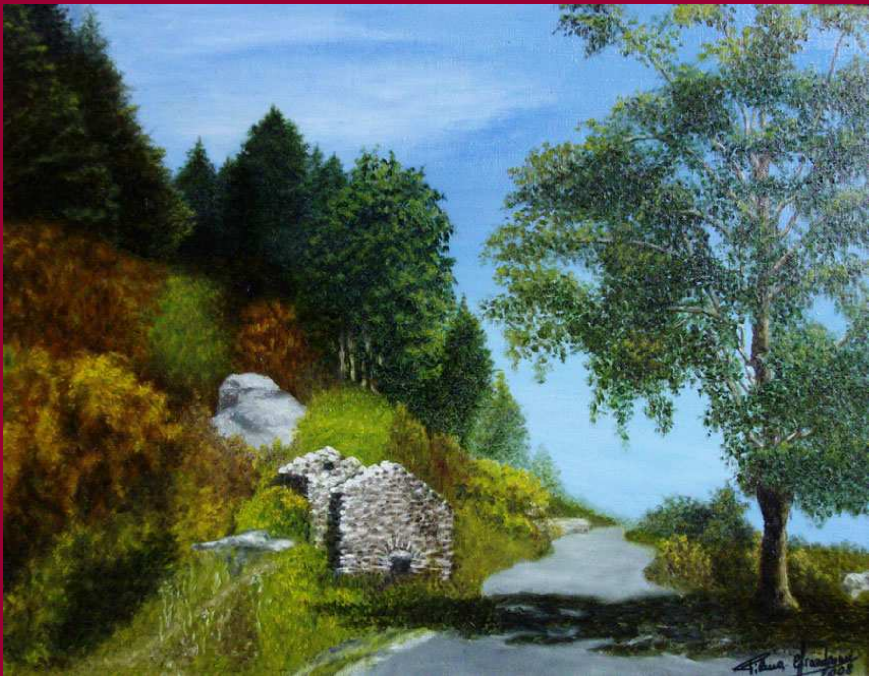
"VESTIGIA DEL PASSATO" olio su tela 35x45