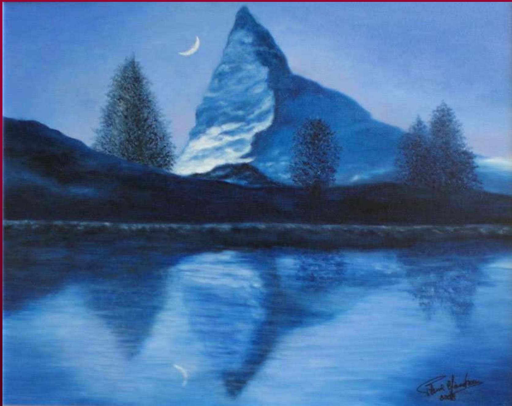
"FREDDO IN BLU" olio su tela 40x50