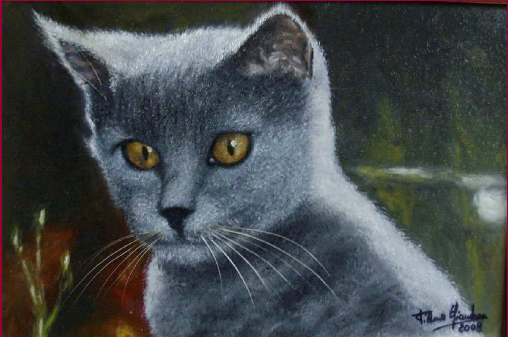
"MAGICO SGUARDO" olio su tela 20x30