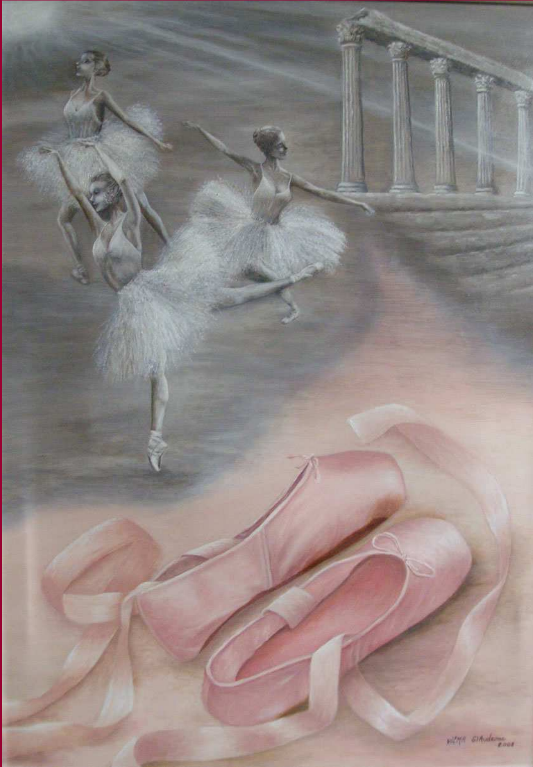
"SOGNO DI DUE SCARPETTE DA PUNTA" olio su tela 50x70