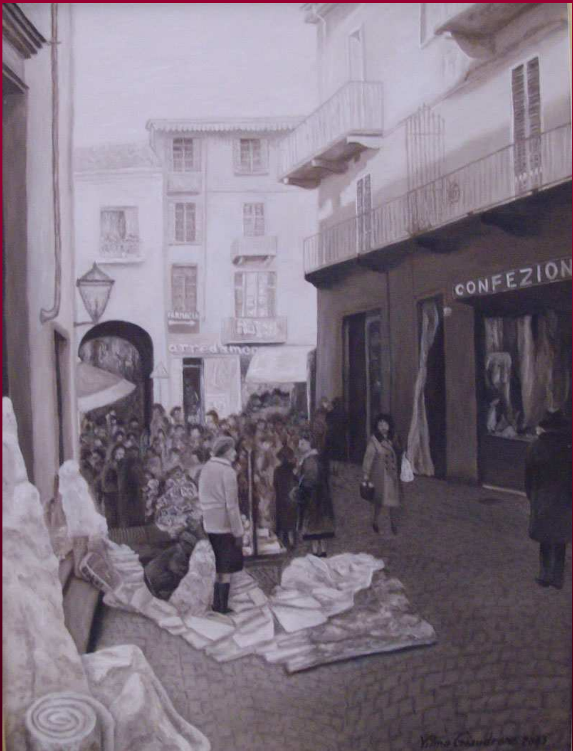
"AL MERCA' DAL GIOBBIA" olio su tela 30x40