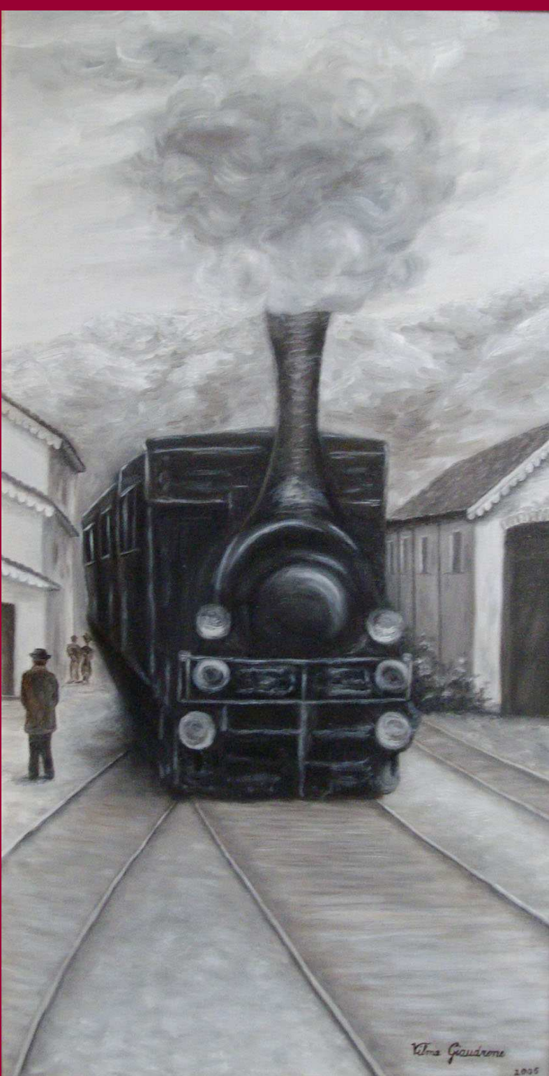
"LA CANAVESANA" olio su tela 30x60