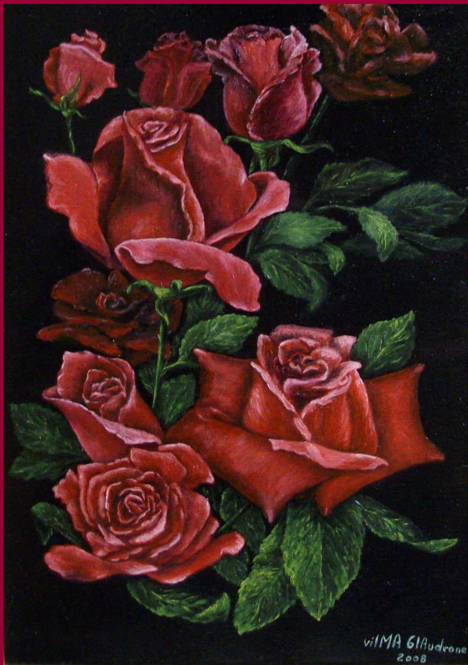
"PASSIONE ROMANTICA" olio su tela 25x35