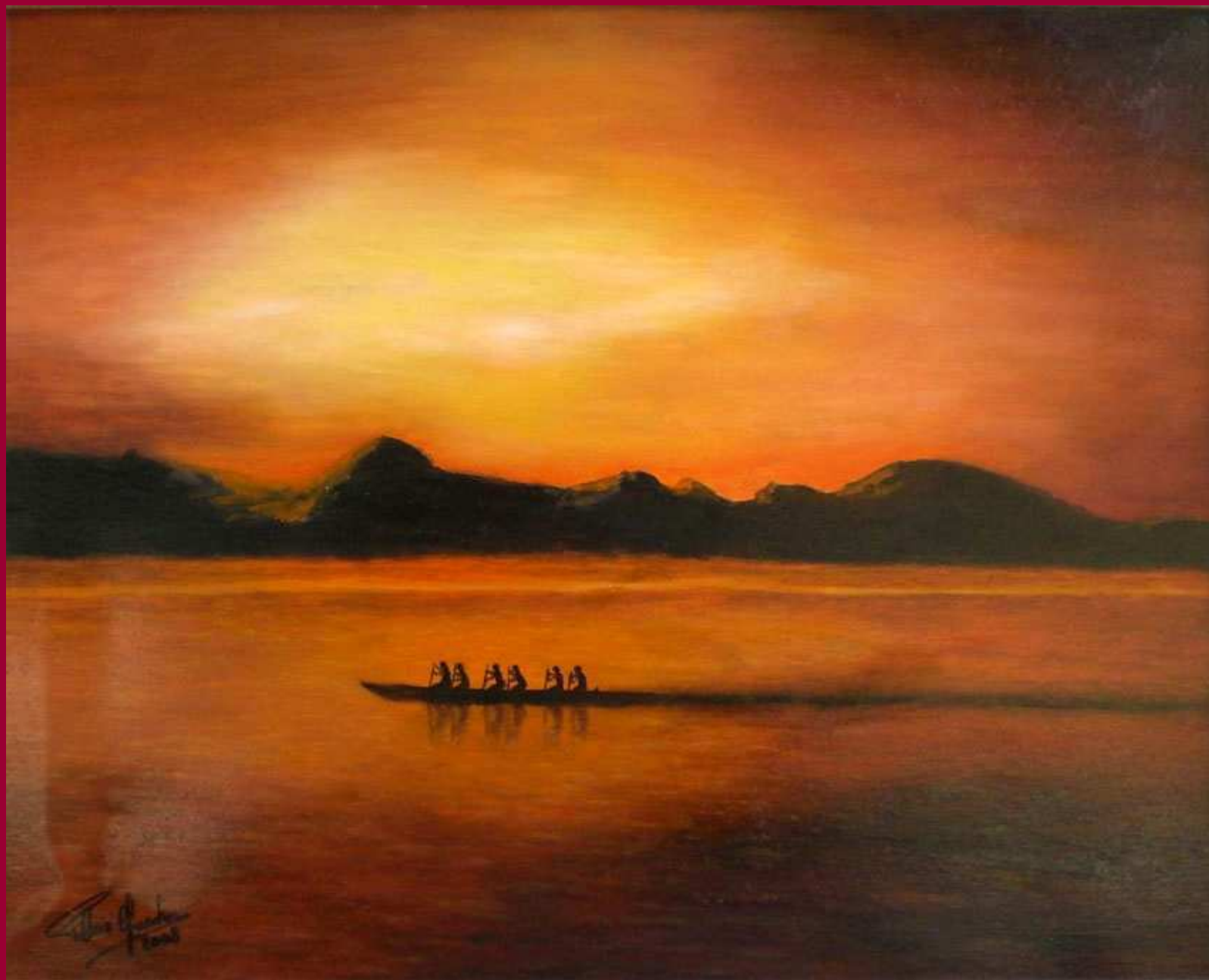
"IL CALORE DEL COLORE" olio su tela 40x50