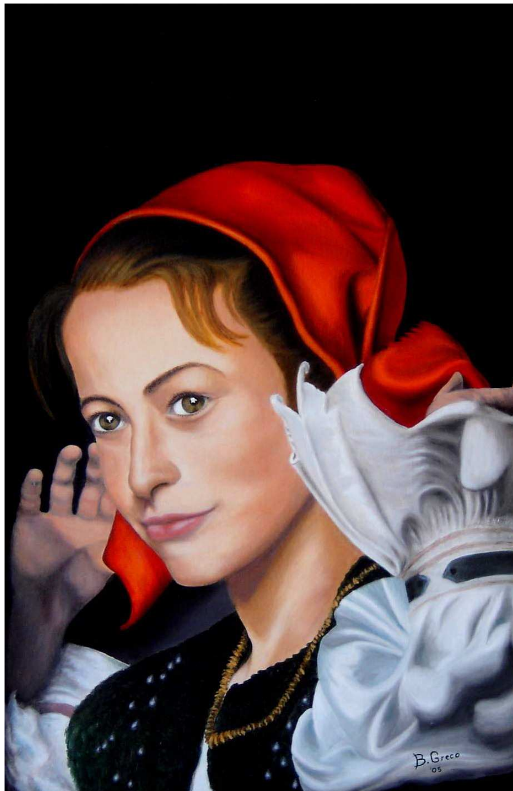
"Giovane ragazza danzante" Olio su tela 50x70 2005