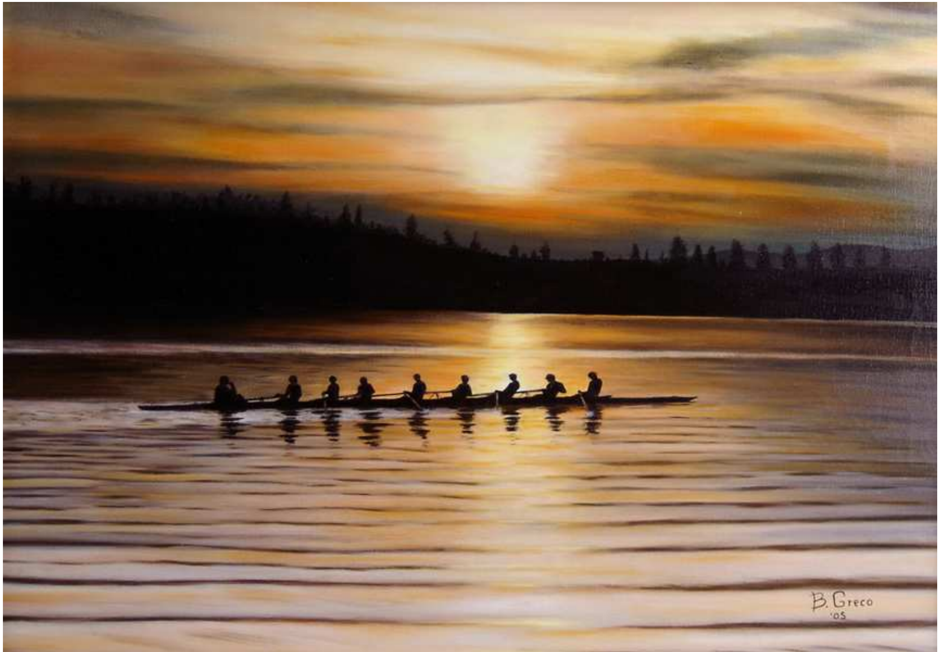
"8 con ... al tramonto", Olio su tela, 70x50, 2005

Le immagini, i contatti e i dati personali sono stati pubblicati con l'autorizzazione dell'artista