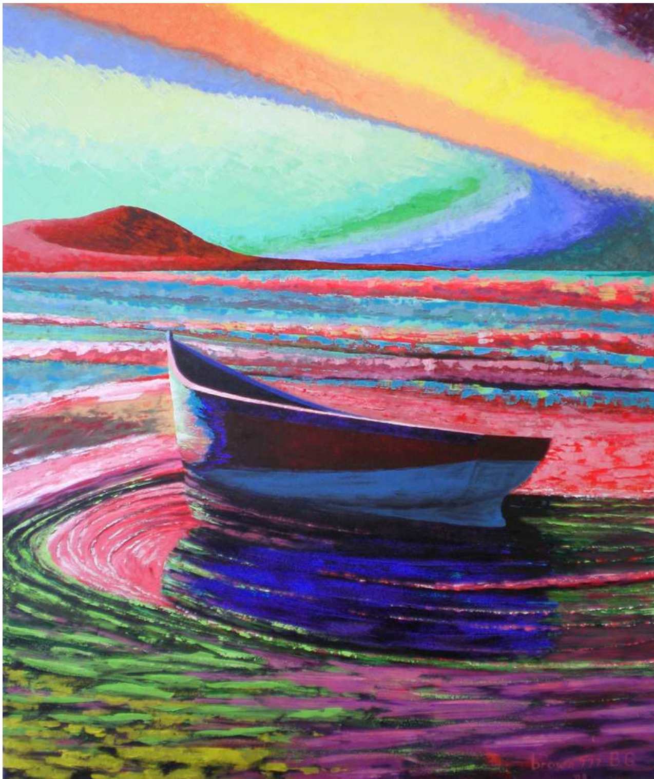
“La barca” Acrilico su tela 100x120 2008