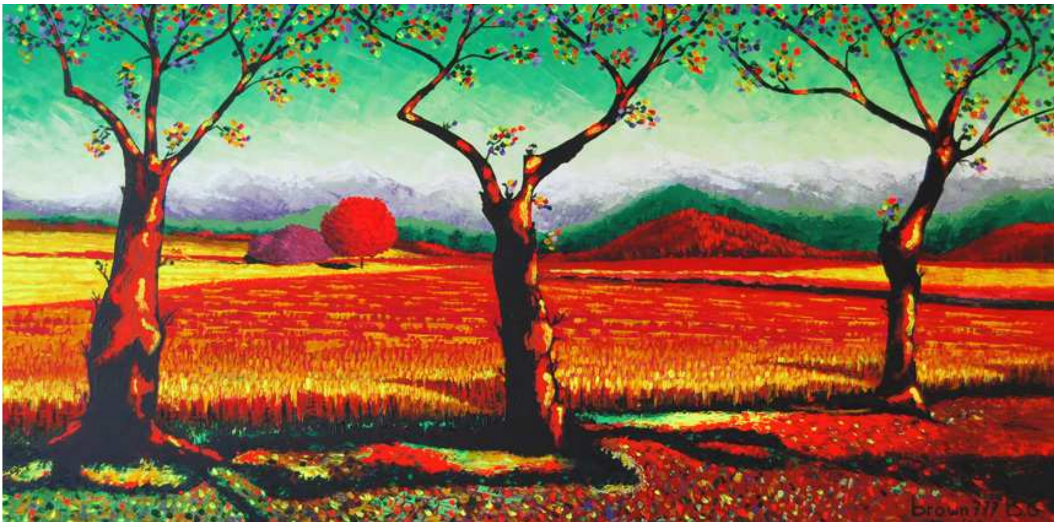
"Solleone" Acrilico su tela 120x60 2008