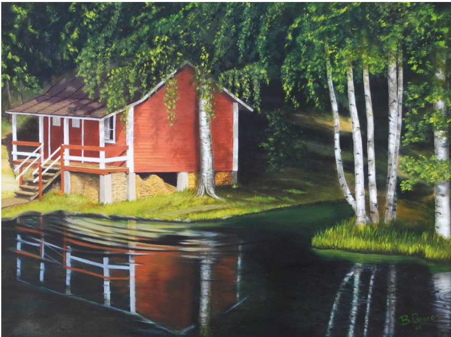
"Quiete", Olio su tela, 80x60, 2005