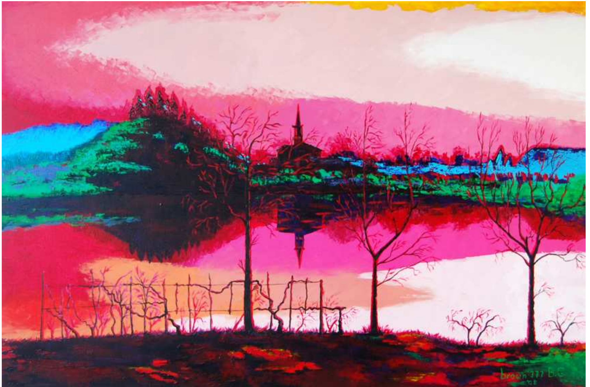
"Colori sul lago", Acrilico su tela, 120x80, 2008