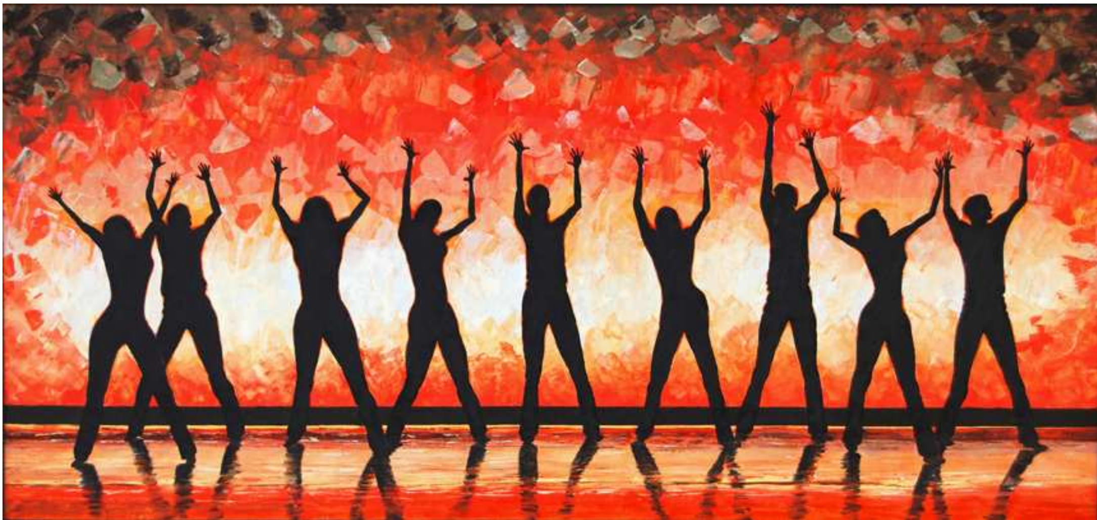
"Danza alla gioia" Acrilico su tela 120x50 2010