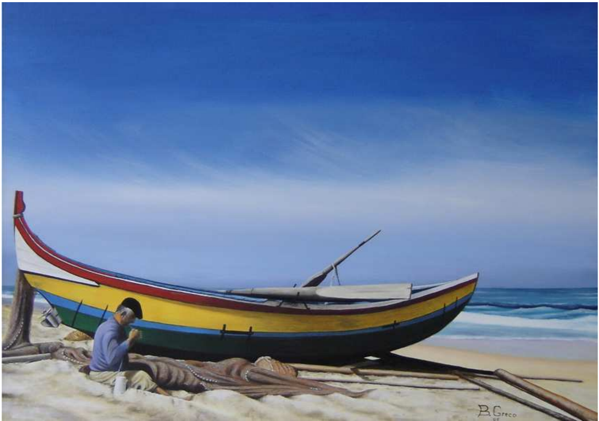
"La barca ed il pescatore", Olio su tela, 70x50, 2006