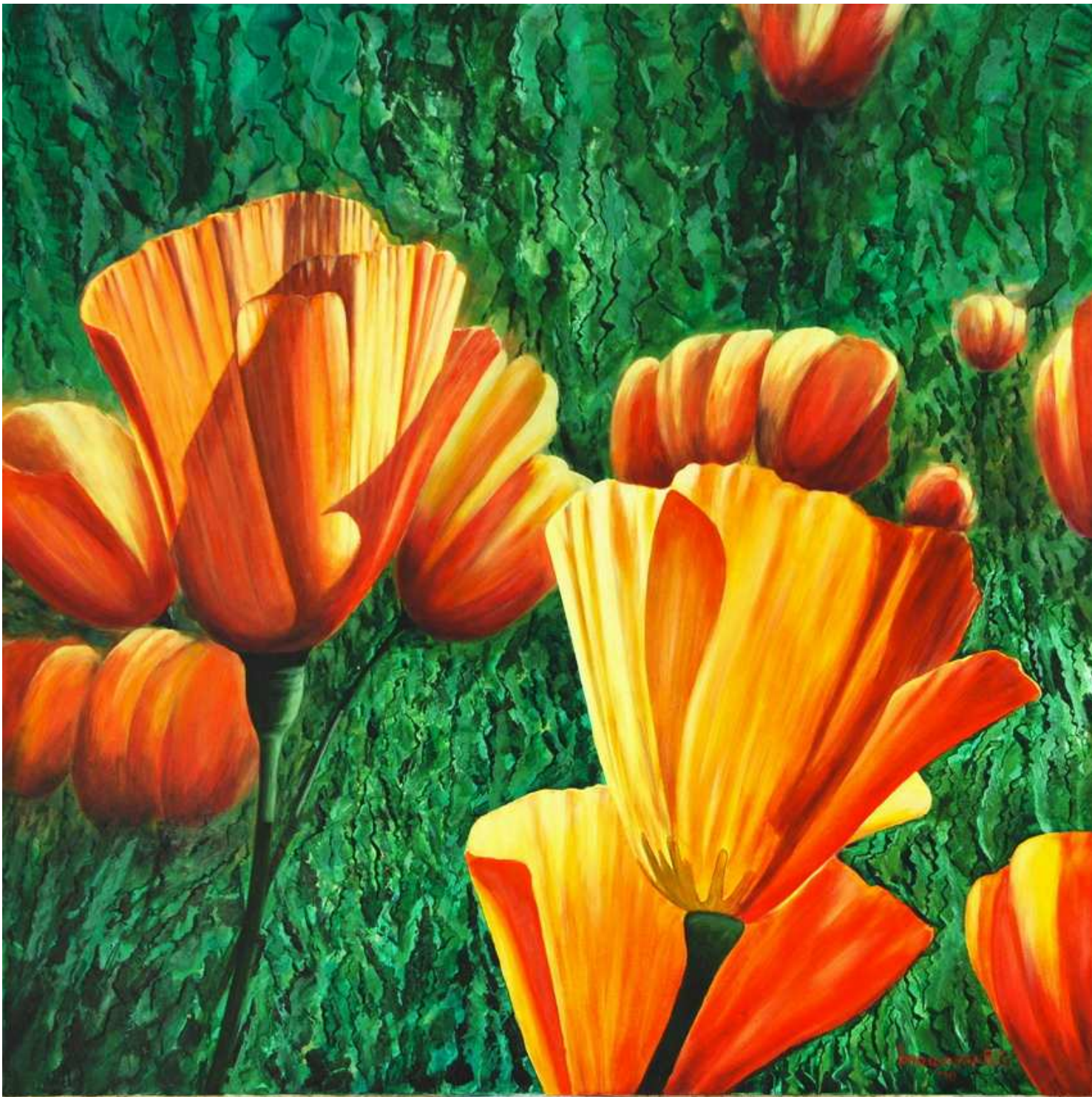
"Fiori 2" Acrilico su tela 90x90 2010