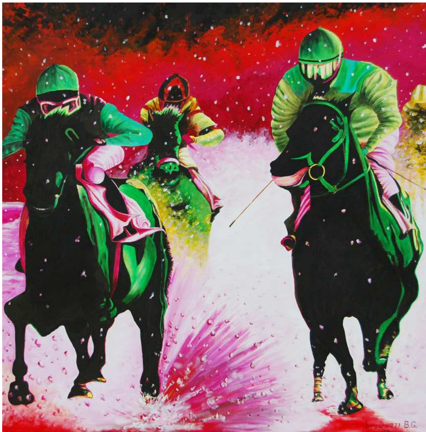
"Corsa sotto la neve", Acrilico su tela, 100x100, 2009