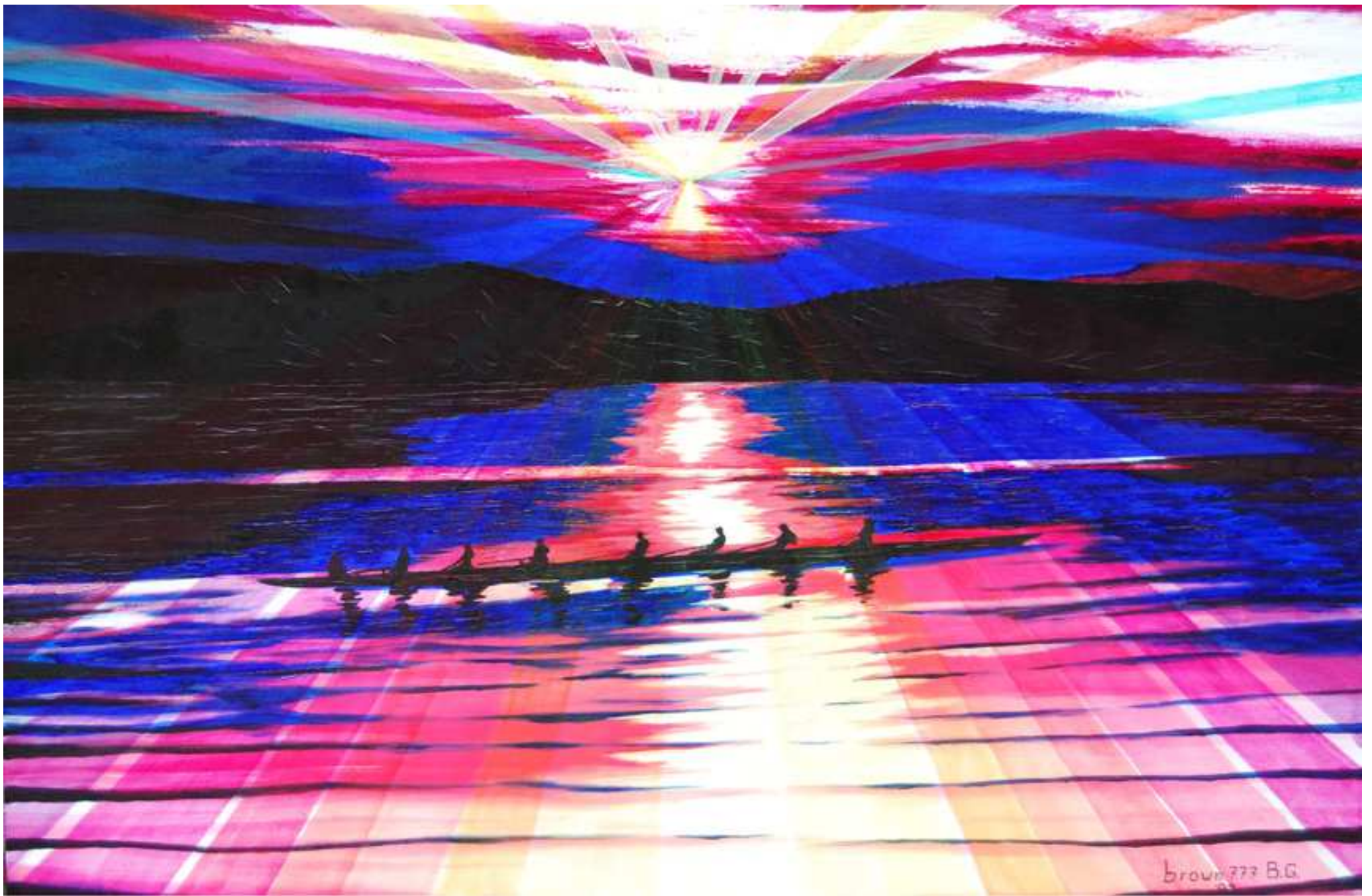
"Raggi sul lago", Acrilico su tela, 120x80, 2009