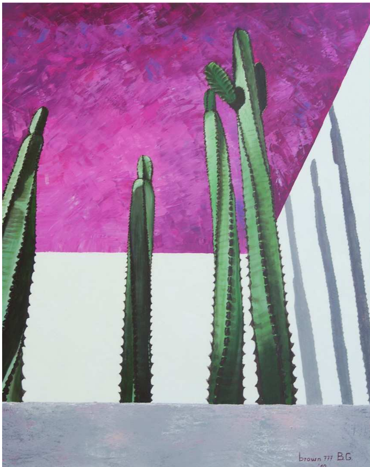
"Le ombre della vita" Acrilico su tela 80x100 2010