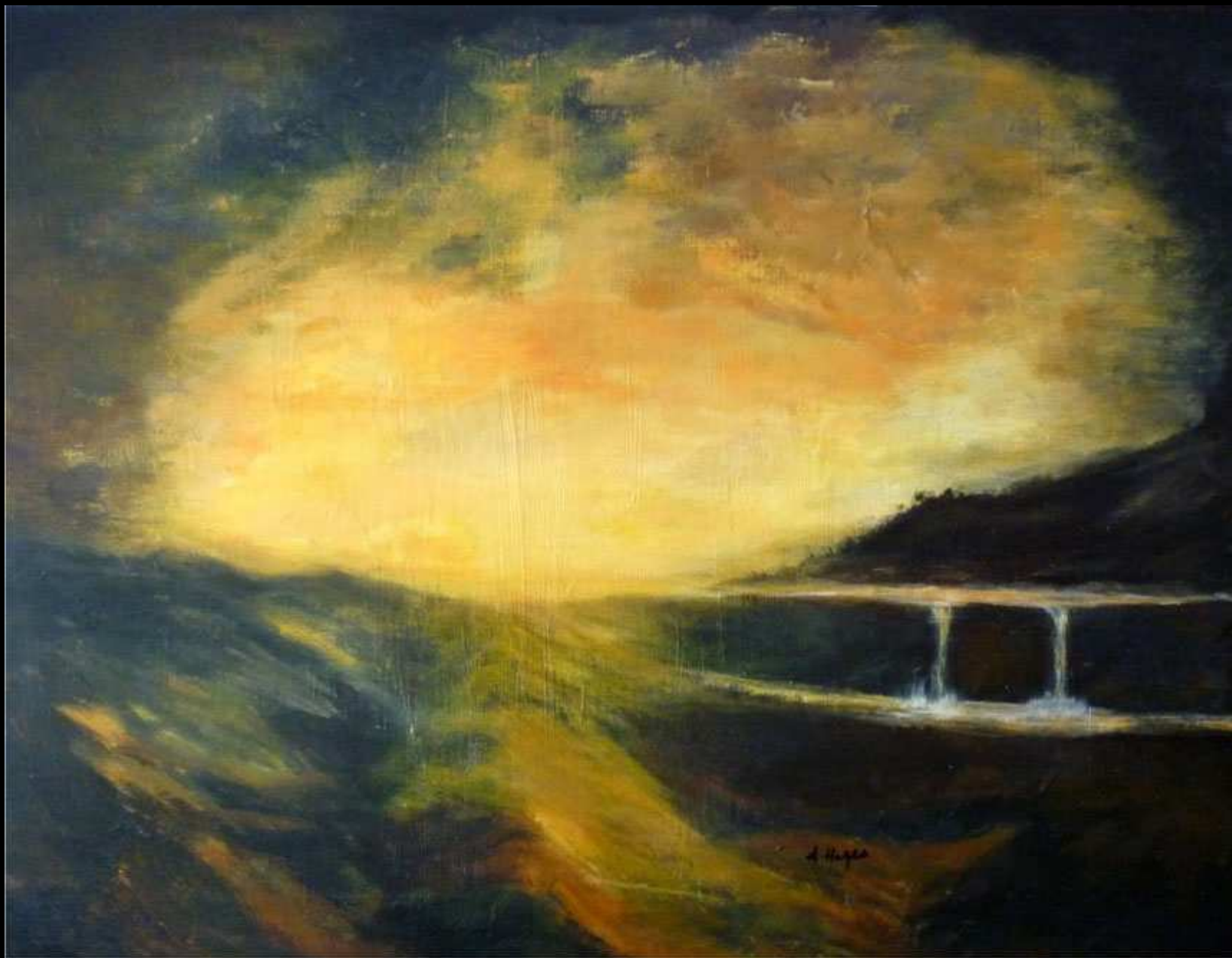
"Diga" acrilico su legno 108x83