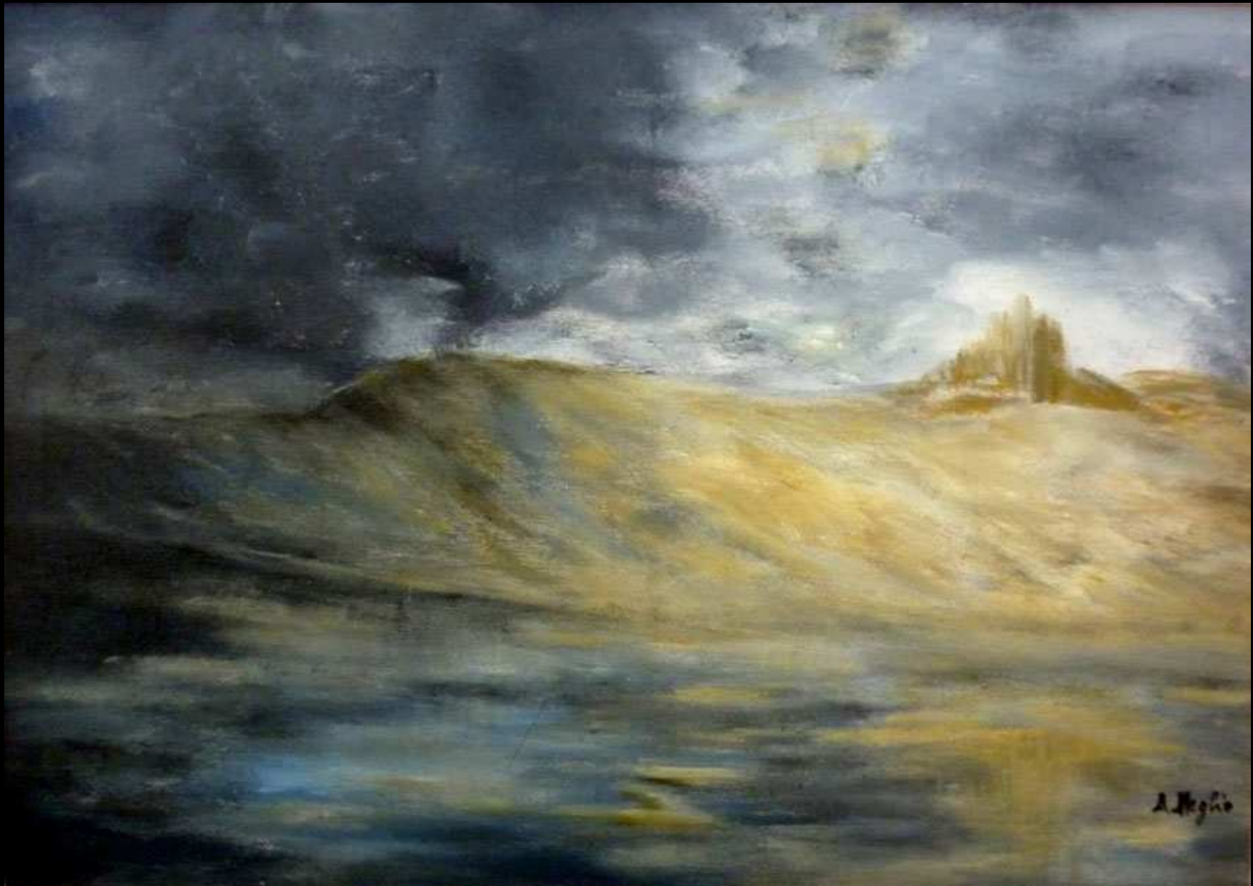
"Castello Irlandese" acrilico su tela 74x54