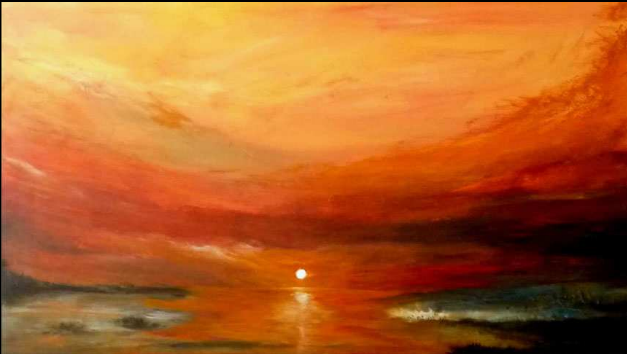
"Crepuscolo" acrilico su legno 105x60