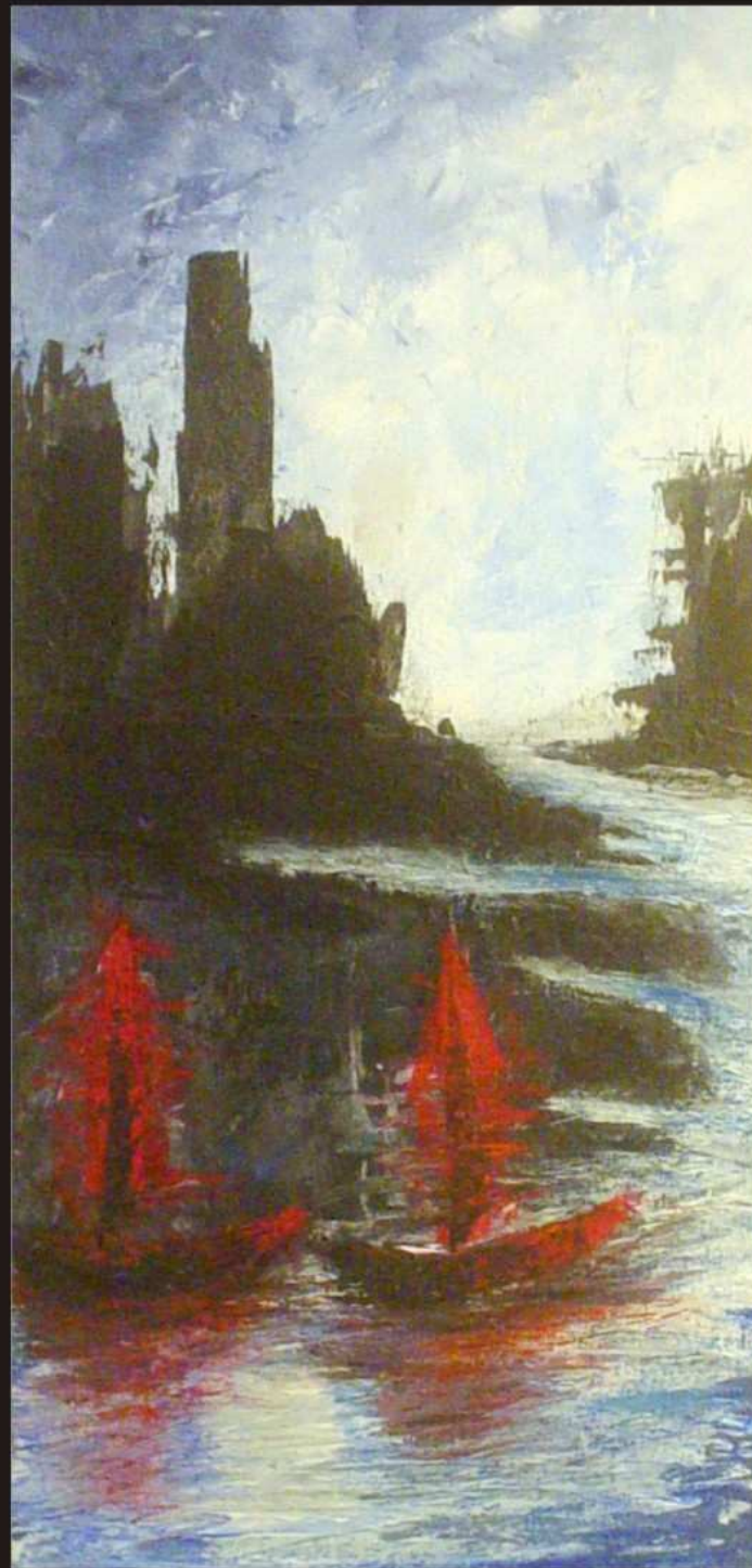
"Vele" tecnica mista acrilico su legno 40x70