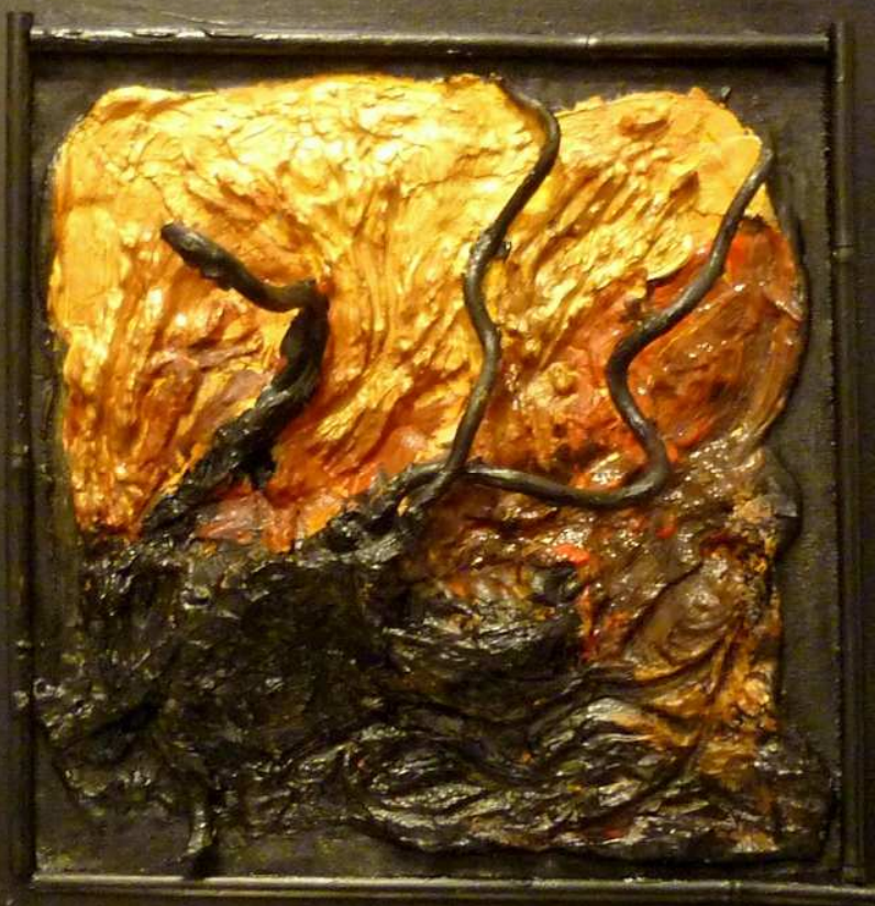
"Radici" composizione su legno 50x60