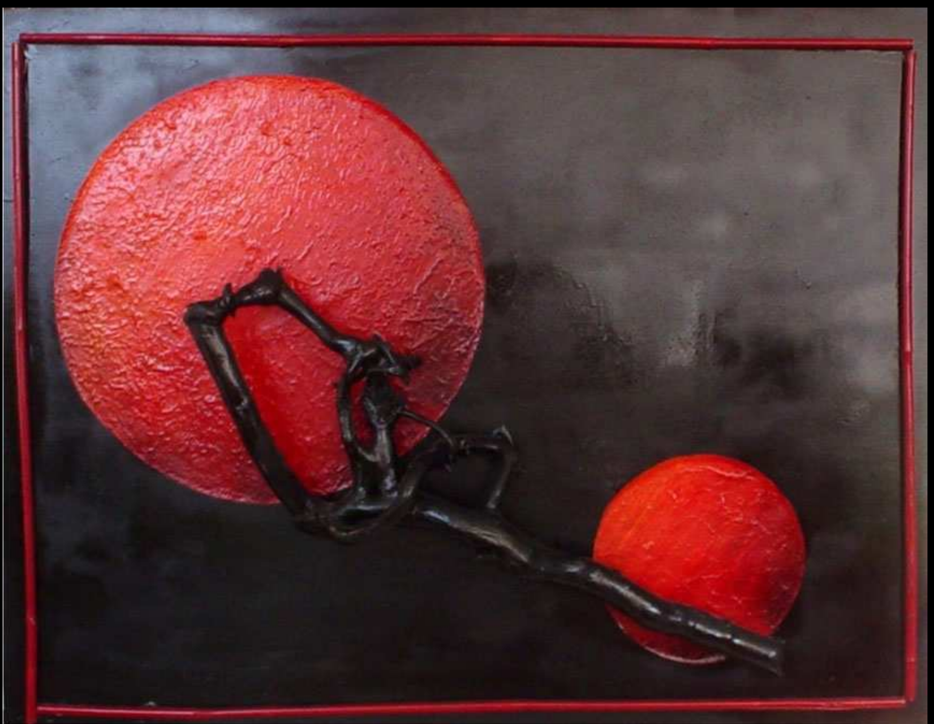
"Unione" acrilico su legno in rilievo 90x70