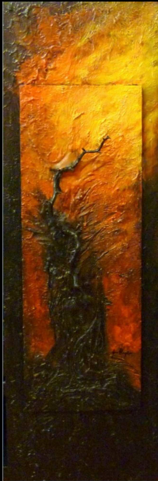
"Inferno" acrilico e ceramica su legno 40x125