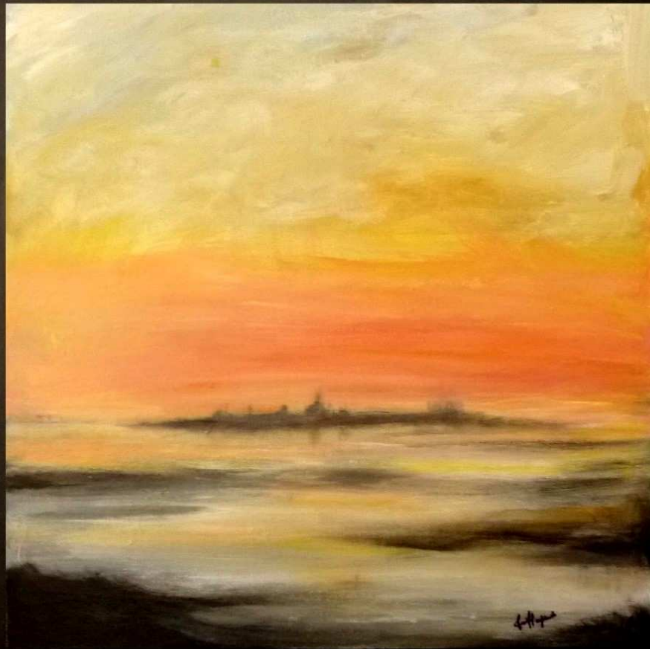
"Alba veneziana" acrilico su legno 70x70

Le immagini, i contatti e i dati personali sono stati pubblicati con l'autorizzazione dell'artista