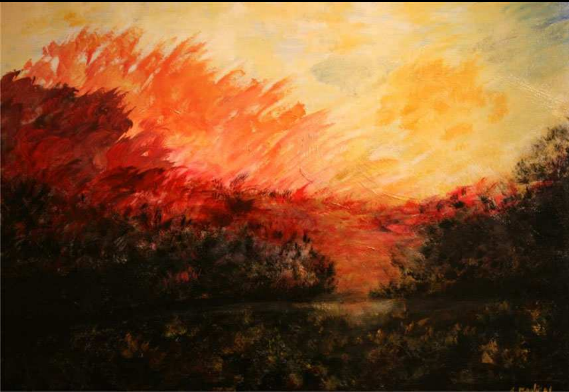
"Incendio" acrilico su legno 100x70