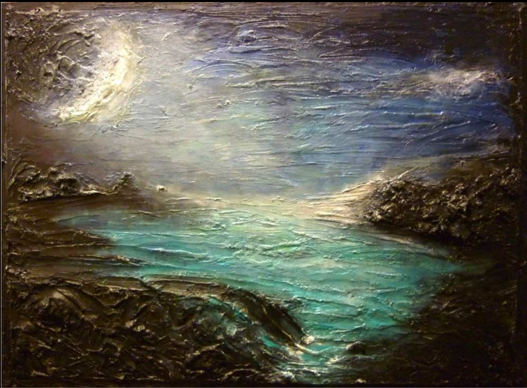
"Notturmo lunare" acrilico e ceramica su legno 88x65