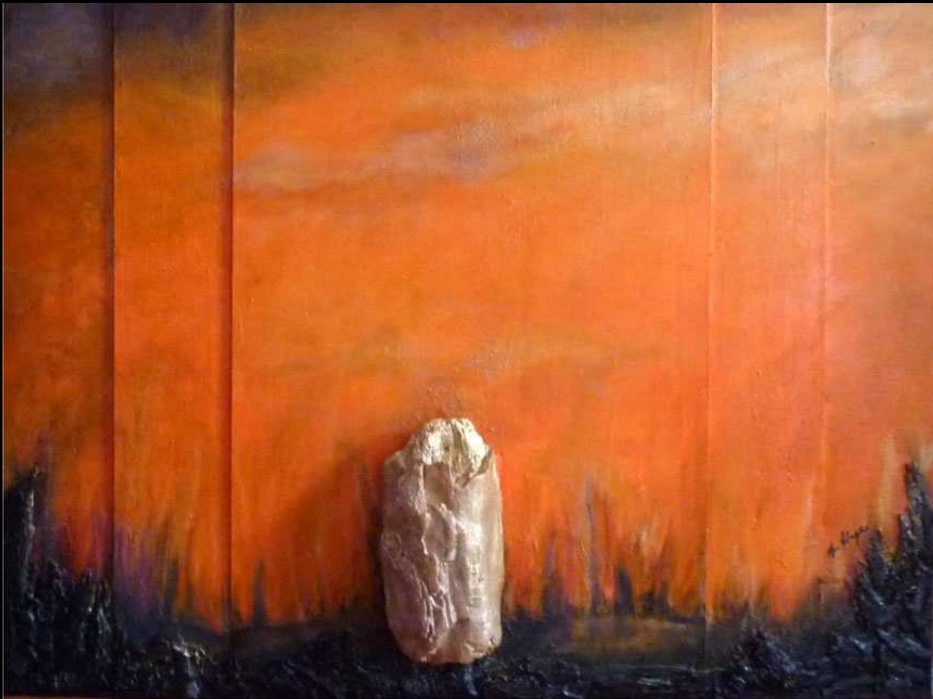
"Il giorno dopo" tecnica mista su legno 80x60