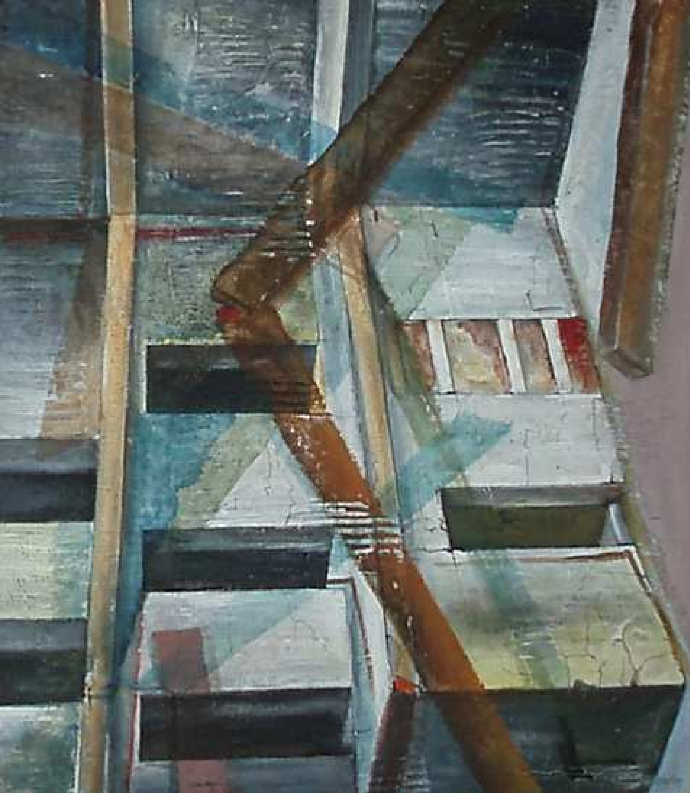
"L'Ombra di Electra" tecnica mista su intonaco 70x80 2009