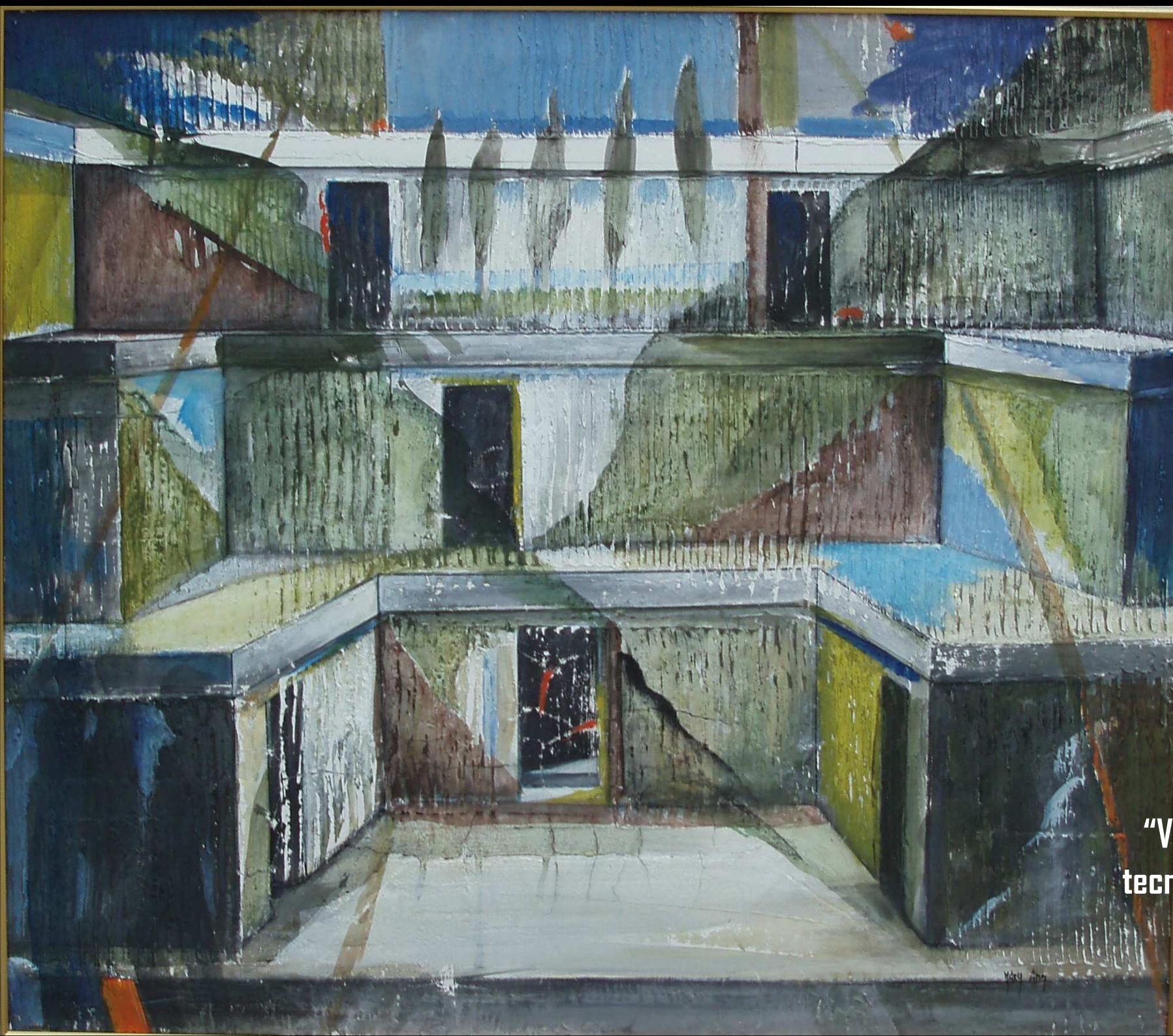
"Voglia di...Paesaggio" tecnica mista su intonaco 70x80 2009