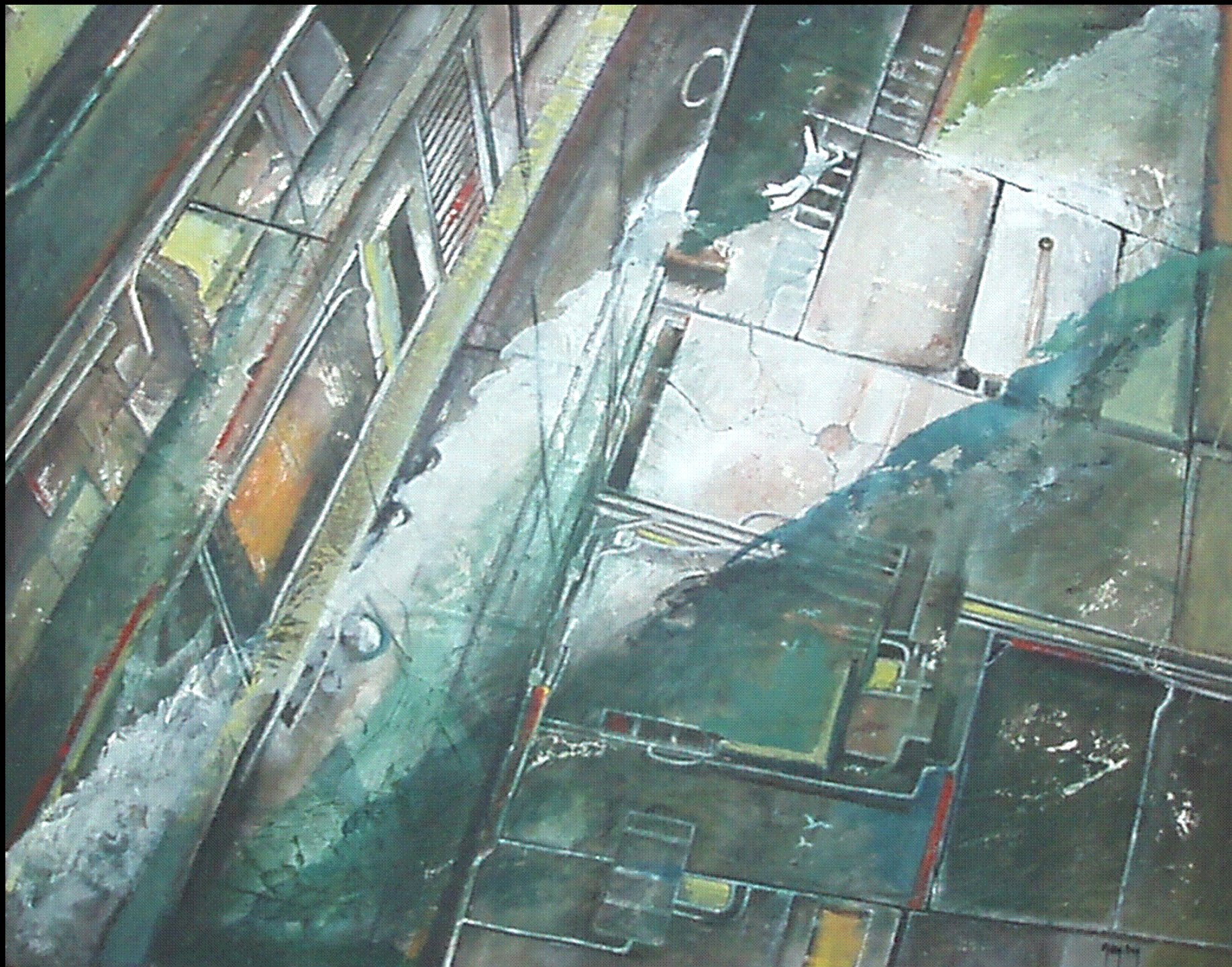
"L'Ultimo Uomo", tecnica mista su intonaco, 70x80, 2009