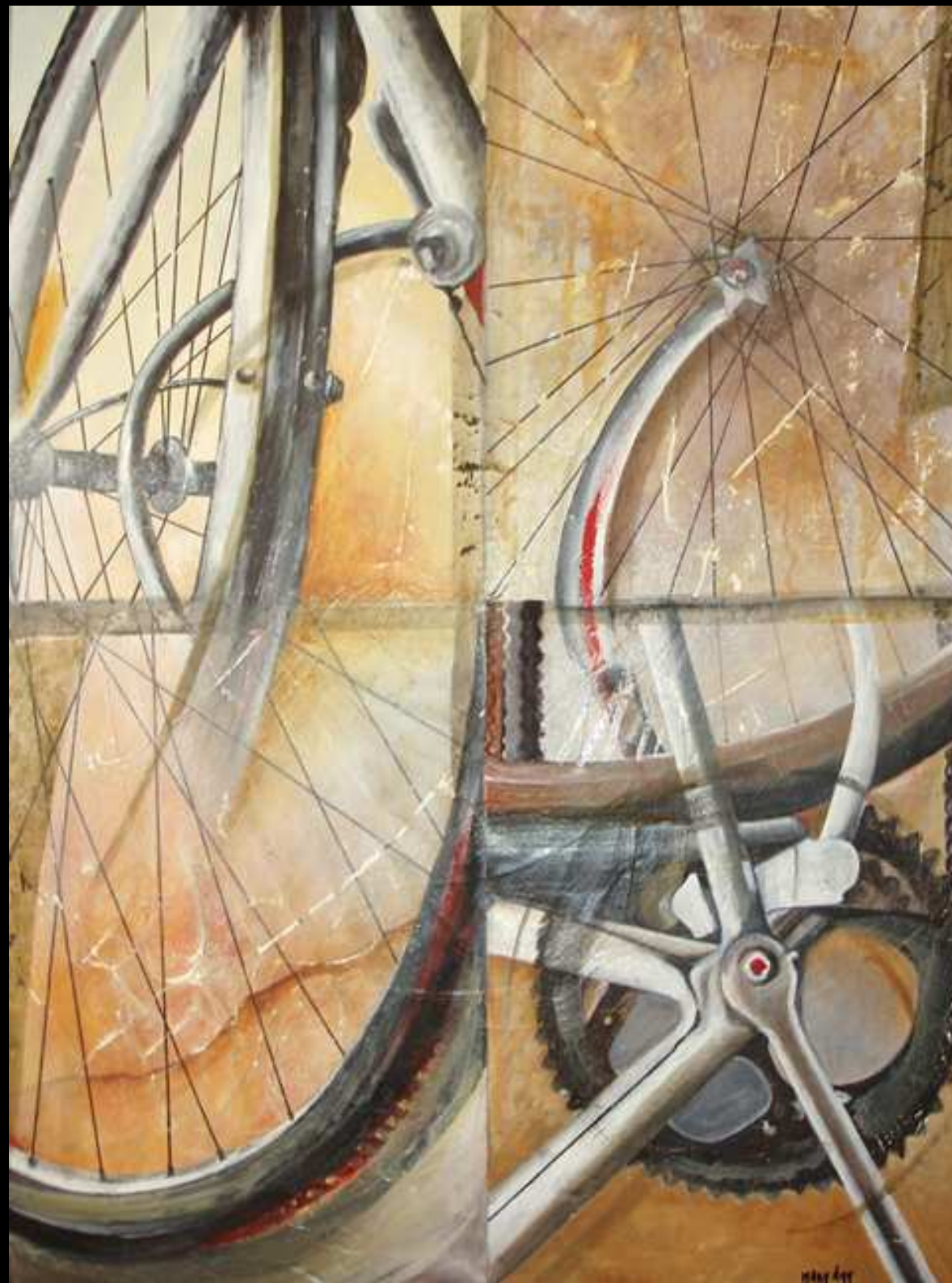
"Equilibri Nascosti 4" tecnica mista su intonaco 60x80 2010