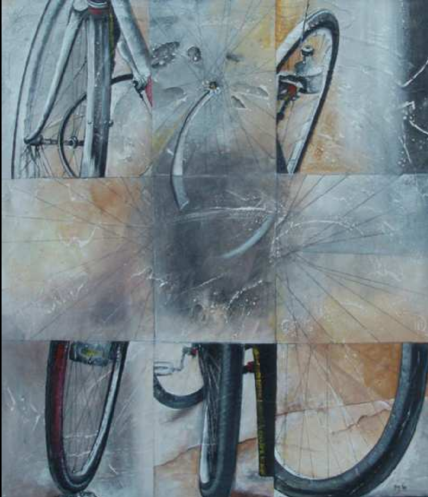
"Equilibri Nascosti 1" tecnica mista su intonaco 70 x 80 2009