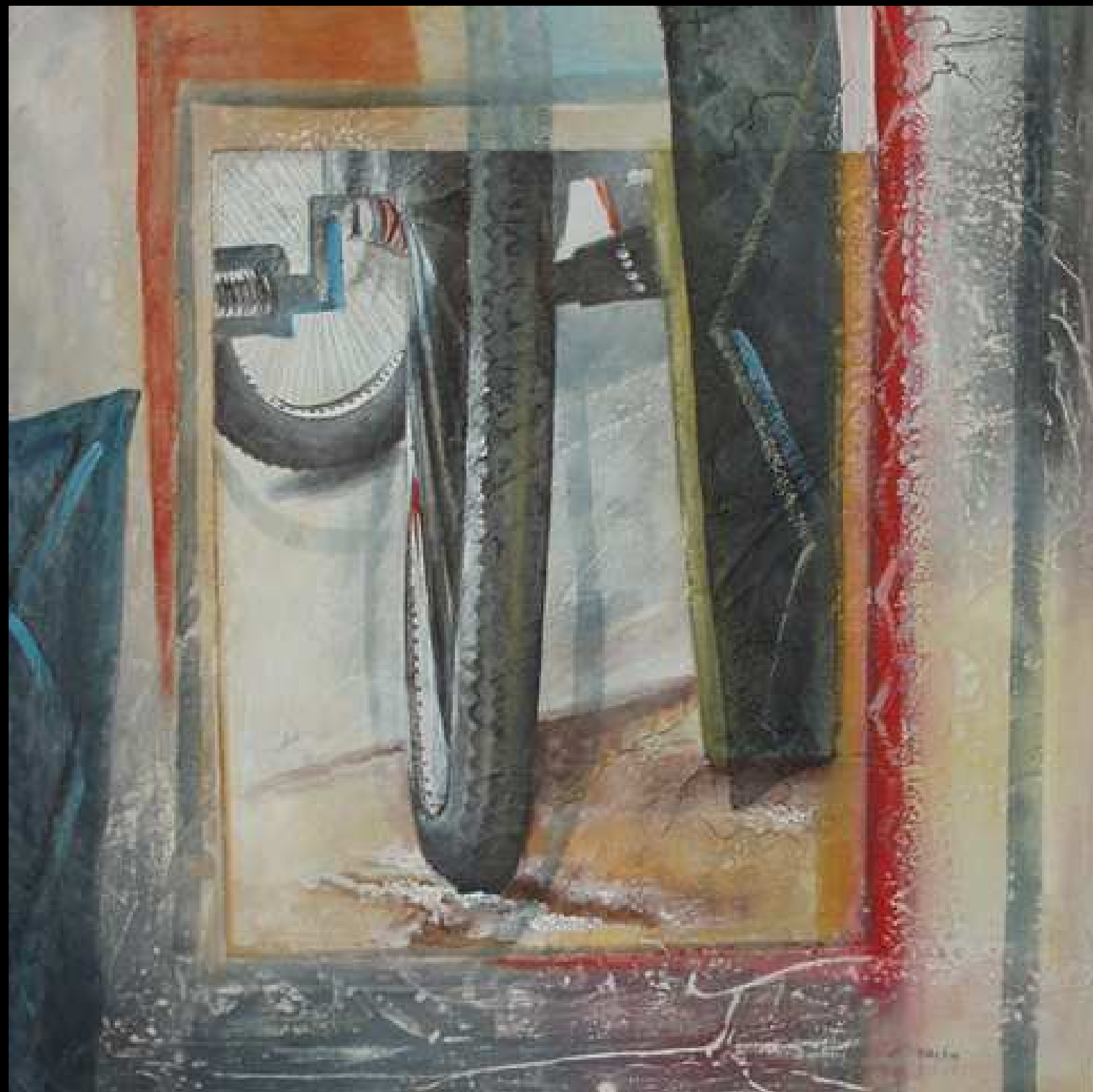
"Equilibri in Attesa 2" tecnica mista su intonaco 70x70 2009

Le immagini, i contatti e i dati personali sono stati pubblicati con l'autorizzazione dell'artista