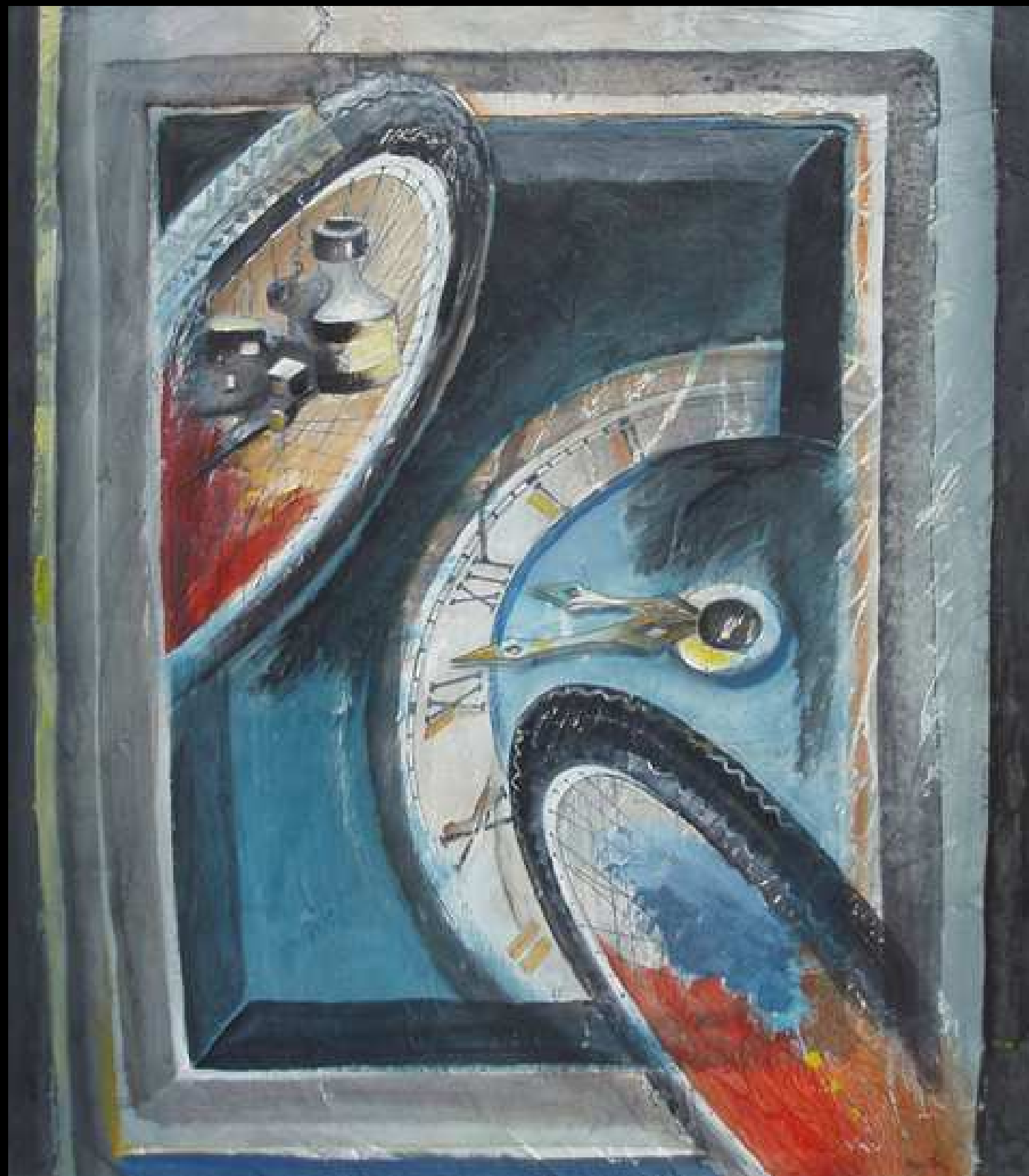
"Il Tempo è Finito" tecnica mista su intonaco 90x90 2009