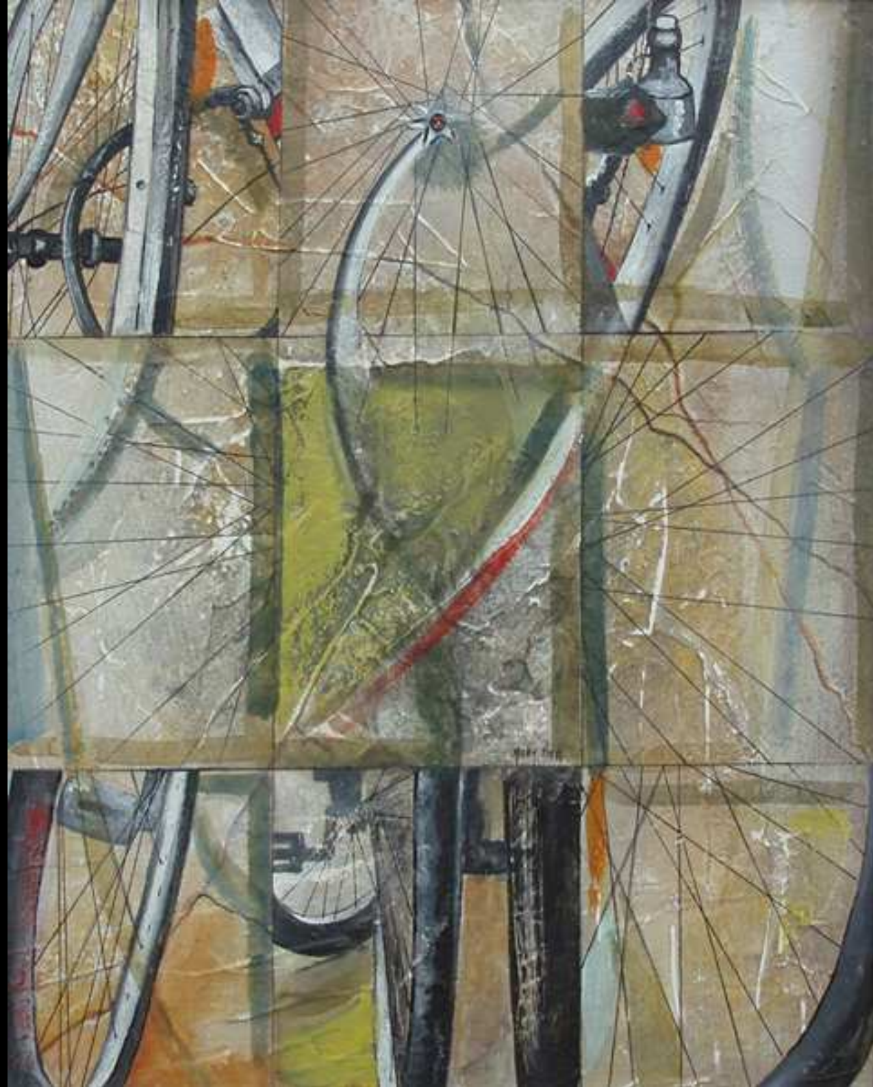
"Equilibri in Attesa" tecnica mista su intonaco 50x40 2010