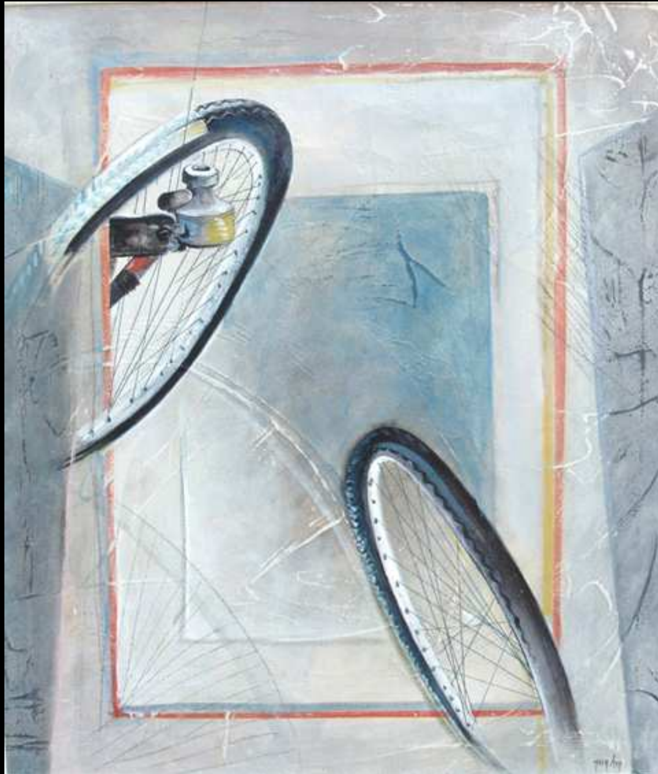
"L'Arduo Equilibrio" tecnica mista su intonaco 70x80 2009