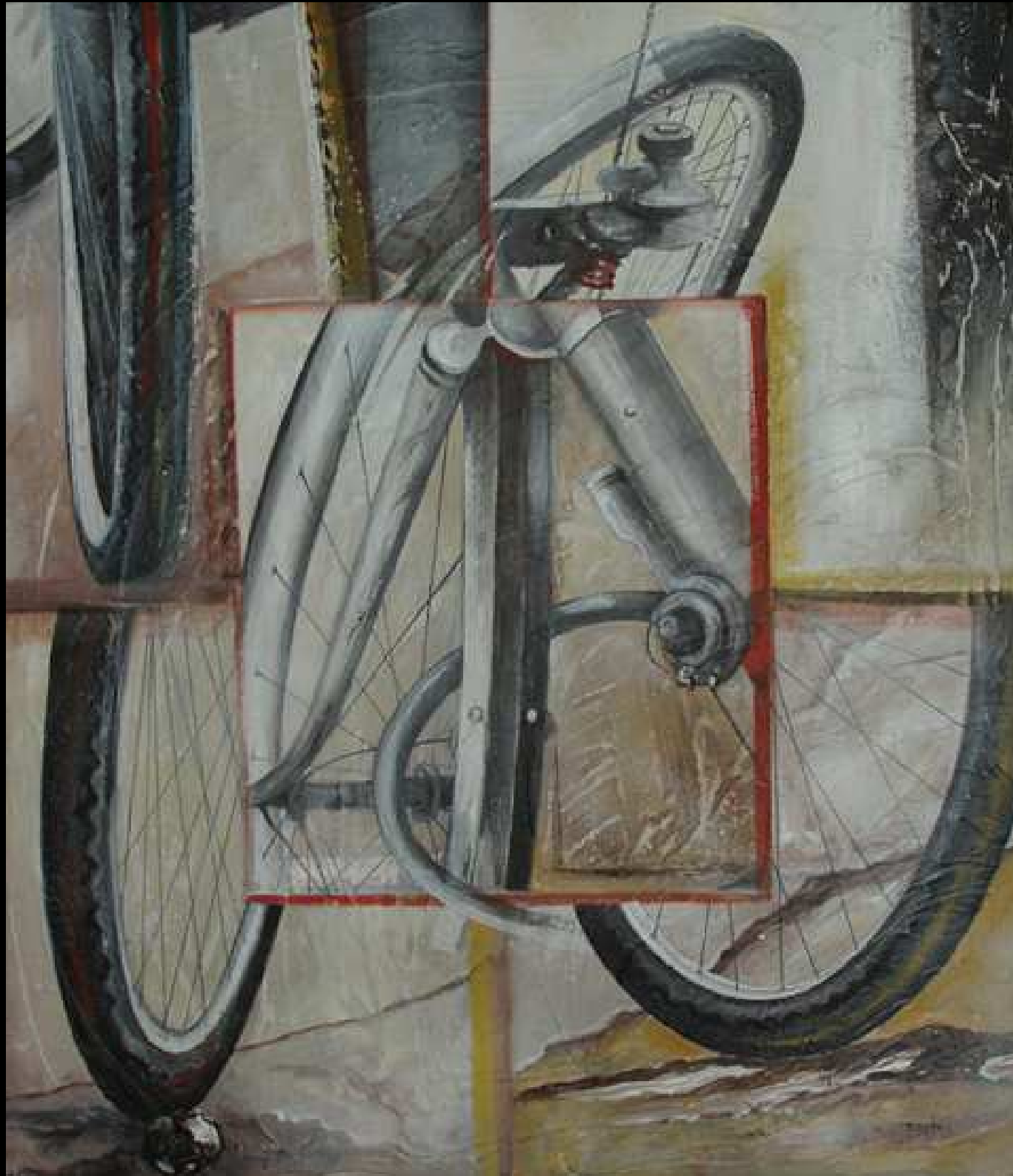
"Equilibri Scomposti" tecnica mista su intonaco 70x80 2009