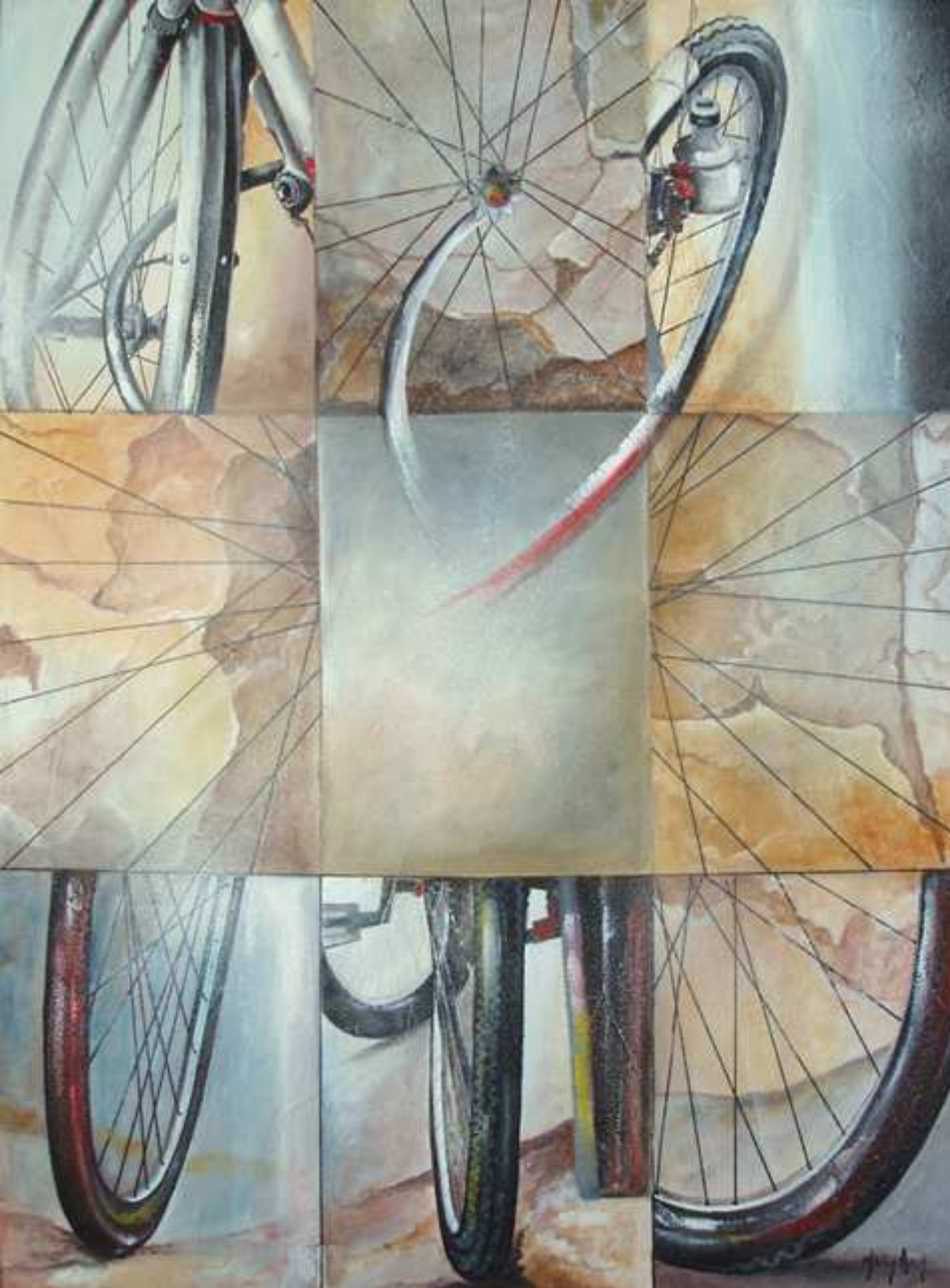
"Equilibri Nascosti" tecnica mista su intonaco 60x80 2010