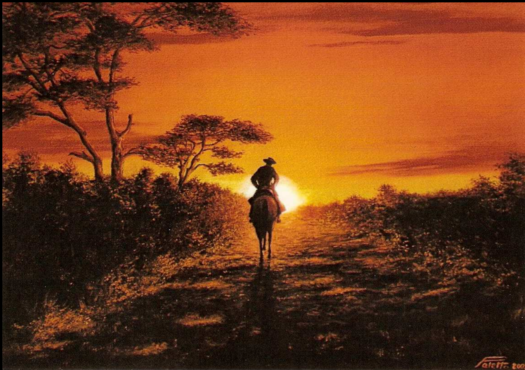
"Tramonto argentino" olio su tela 40x30