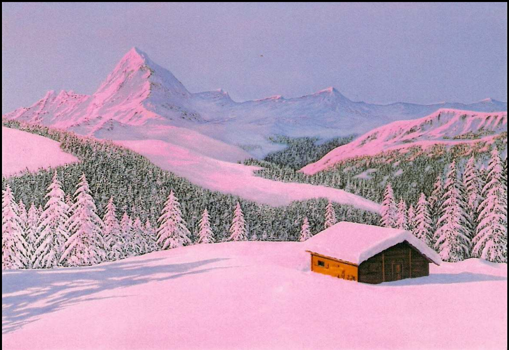
"Nevicata" olio su tela 120x80