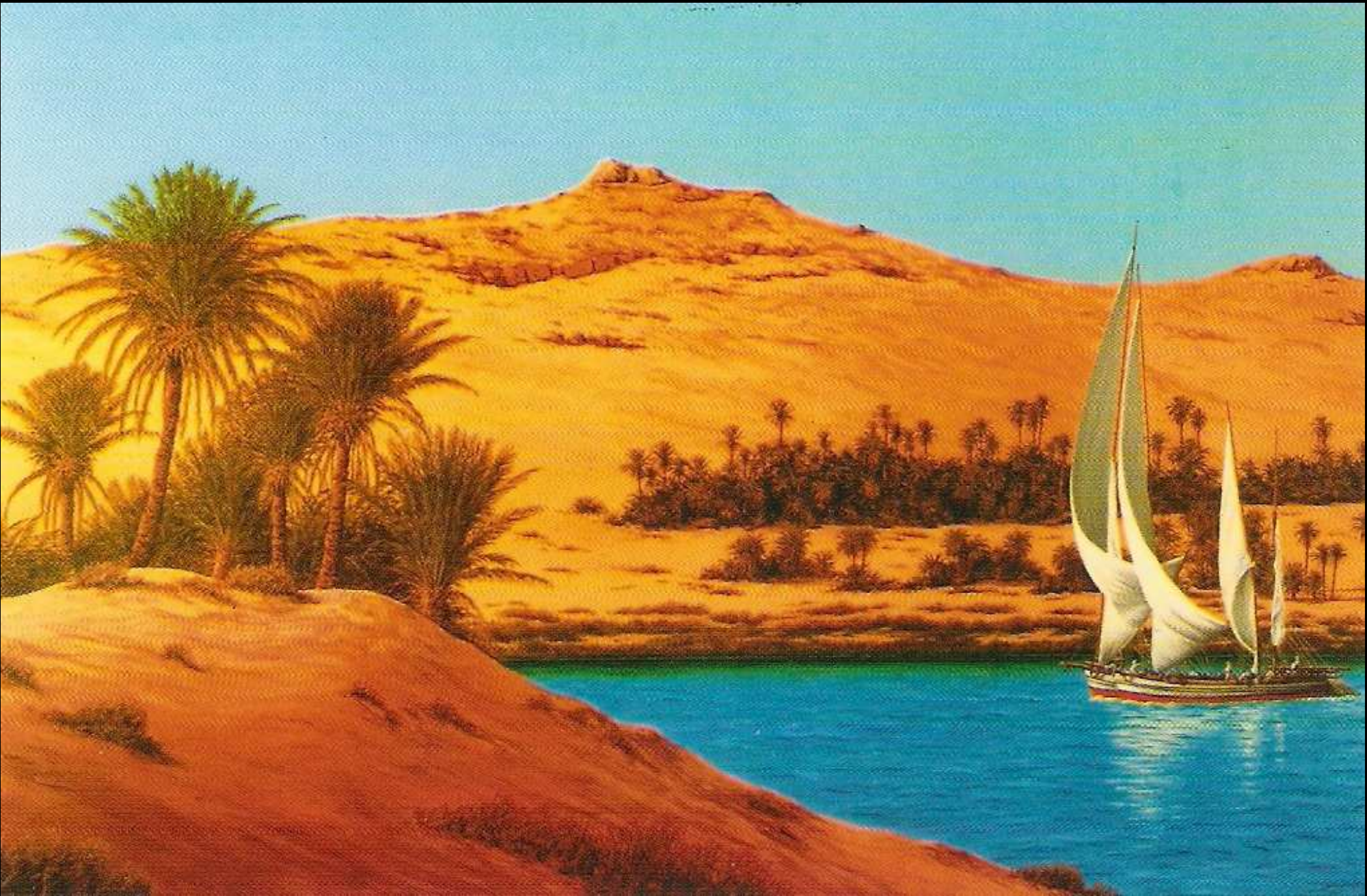
"Lungo il Nilo", olio su tela, 80x120