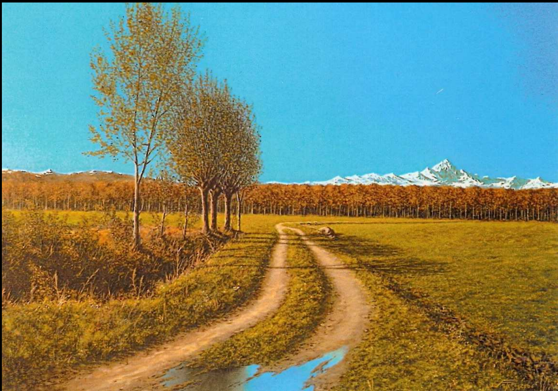
"Pianura sotto il Monviso", olio su tela, 80x60