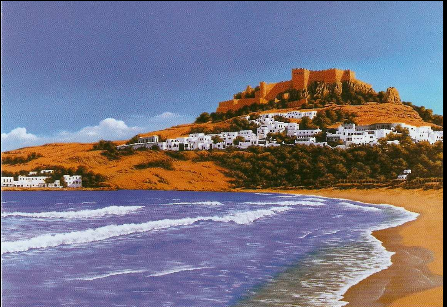
"Rodi, Grecia, Acropoli di Lindos", olio su tela, 120x80