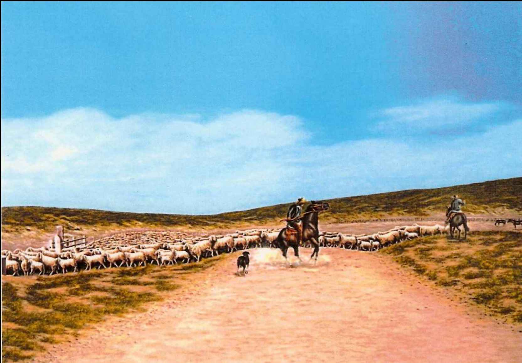
"Terra del Fuoco" pascoli, Cile olio su tela 120x80