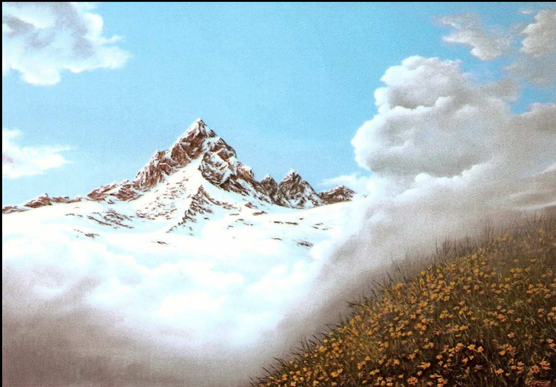
"Monviso", olio su tela, 100x70