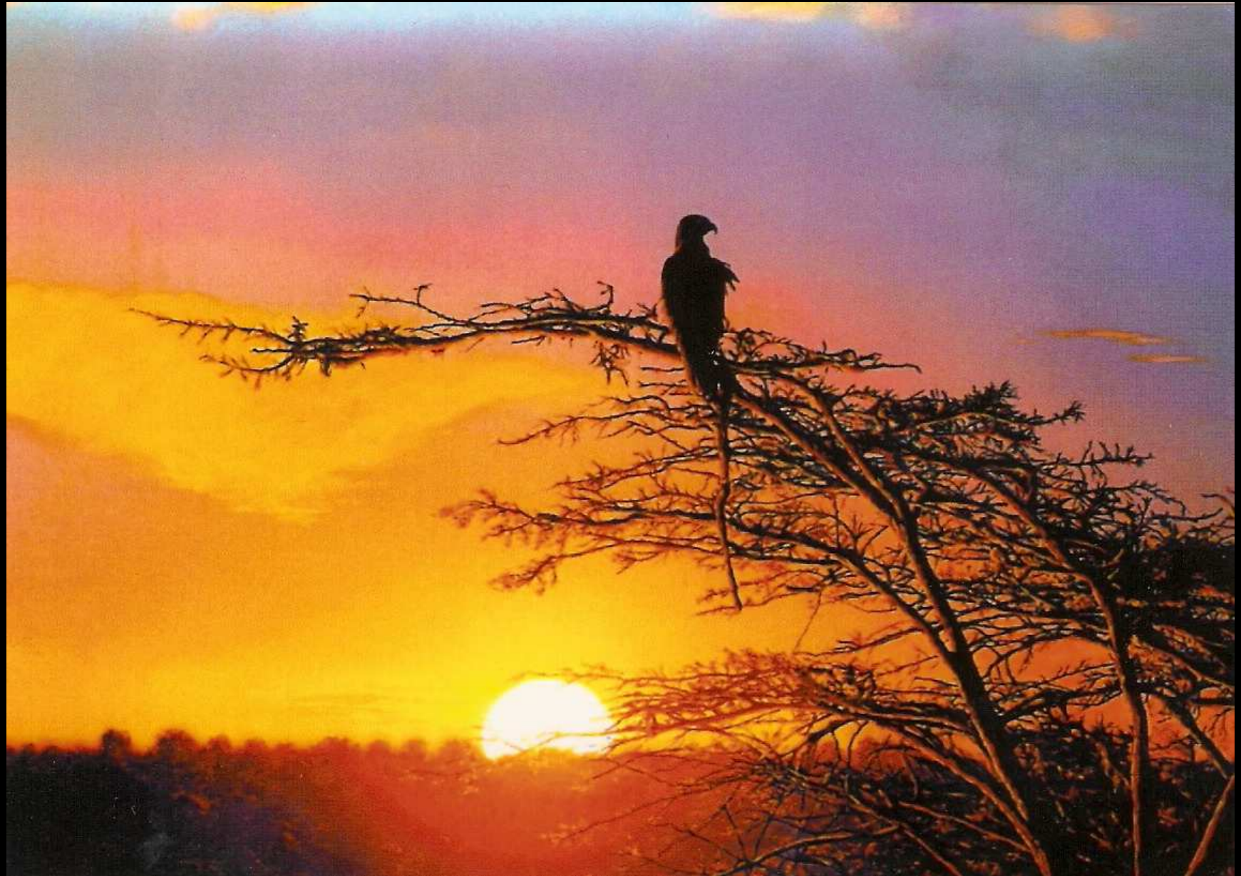
"Tramonto con aquilotto", olio su tela, 100x70