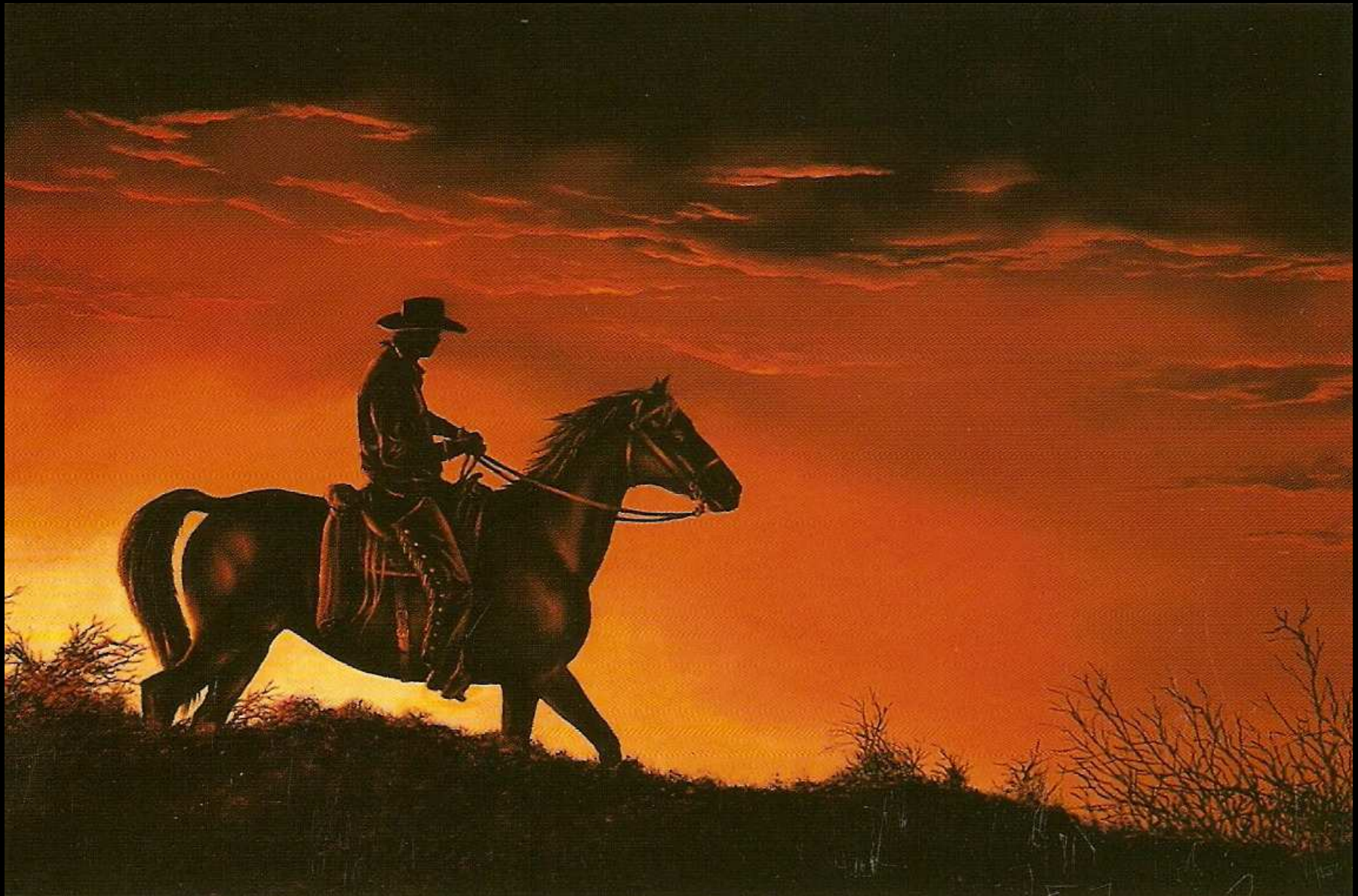
"Tramonto western", olio su tela, 80x55