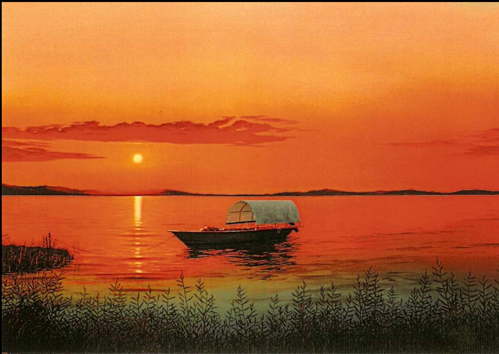
"Imbarcazione lacustre", olio su tela, 120x80

Le immagini, i contatti e i dati personali sono stati pubblicati con l'autorizzazione dell'artista