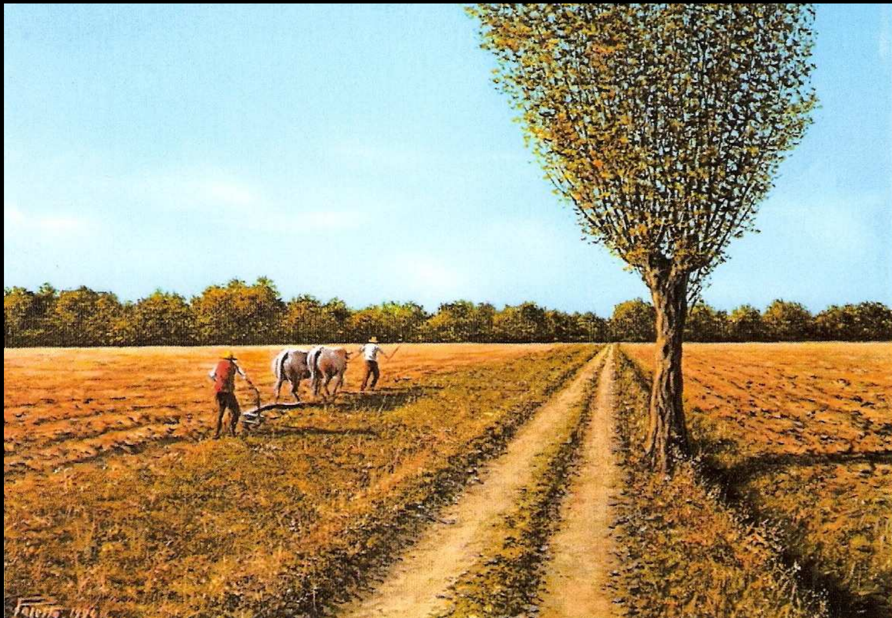
"Aratura" olio su tela 40x30