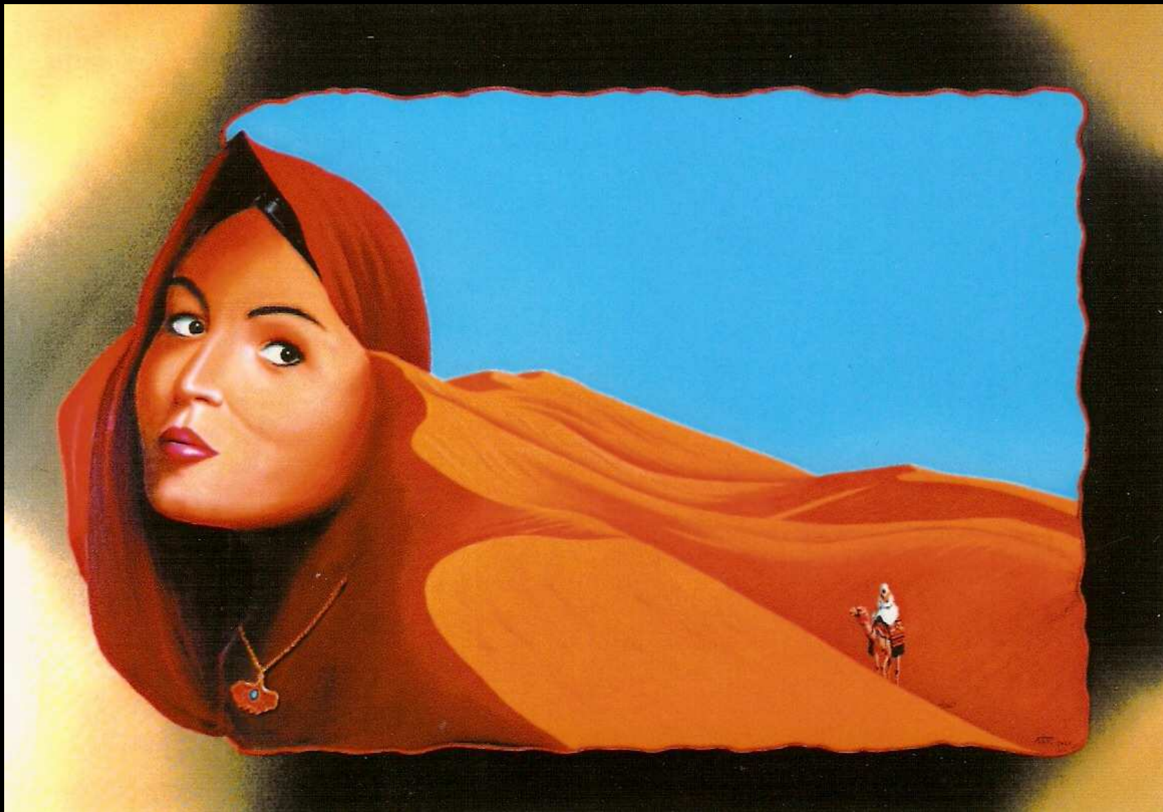
"Incontro sahariano", olio su tela, 100x70