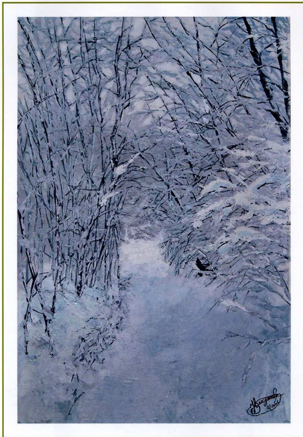
2006 "La riva cita" Acrílico spatolato su tela (50x70)