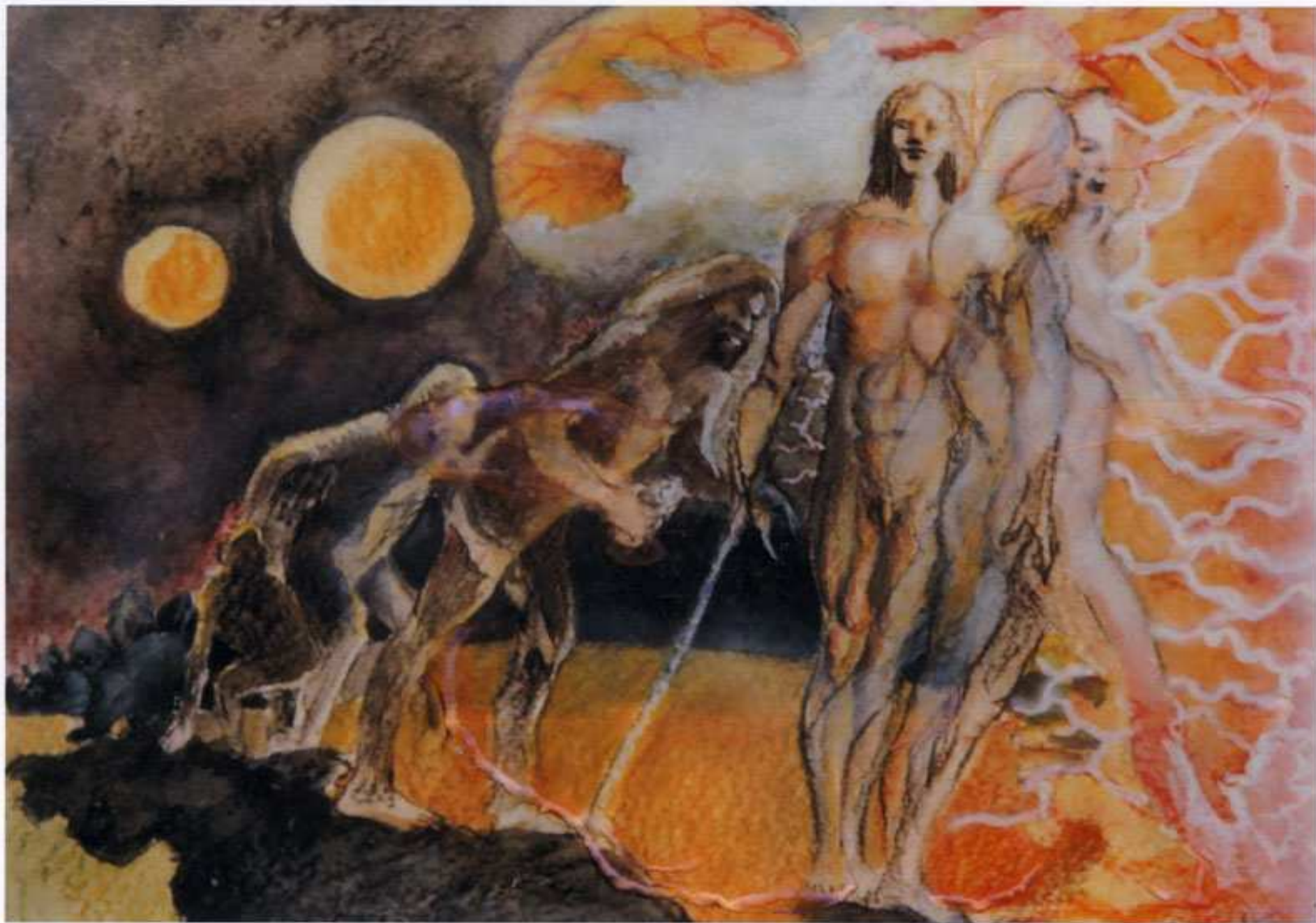
-1986 - "Evoluzione e fine" tecnica mista su cartone schoeller (45x35)