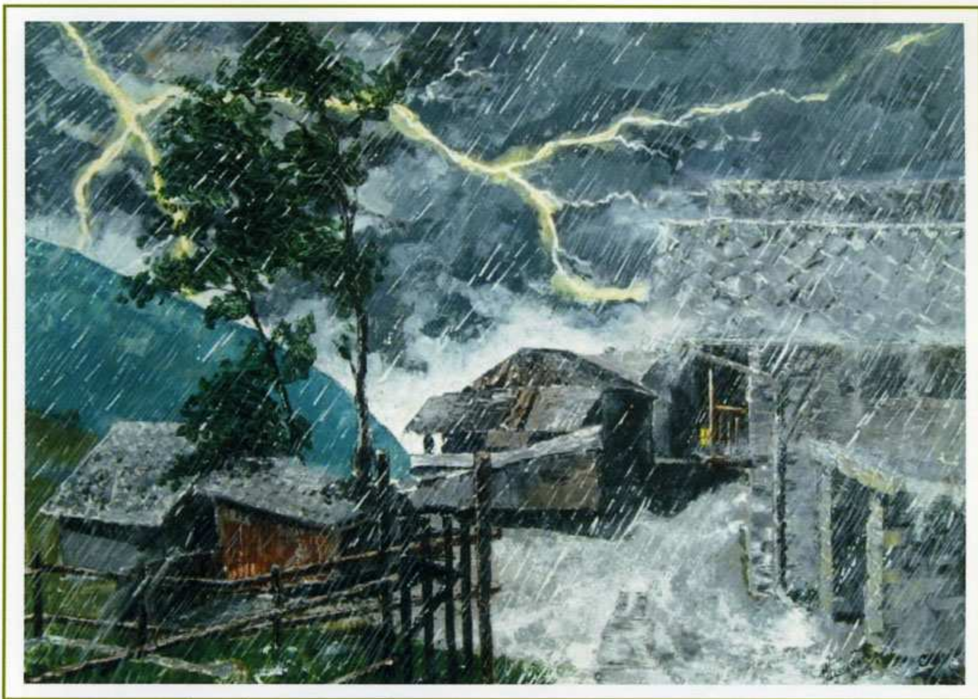
2004 "Temporale a Chamoix" Acrilico spatolato su tela (60x50)