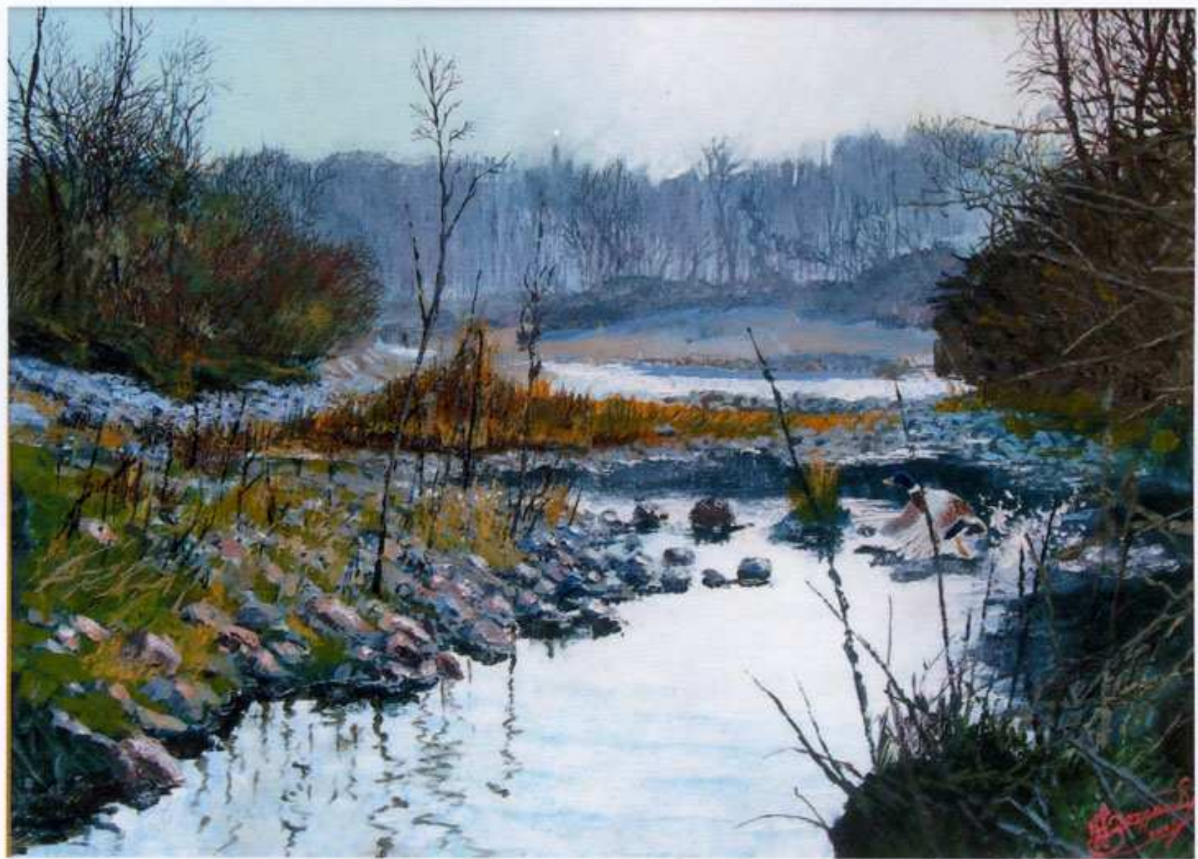
2005 "La fuga" Acrilico spatolato su tela (70x60) Collezione Privata