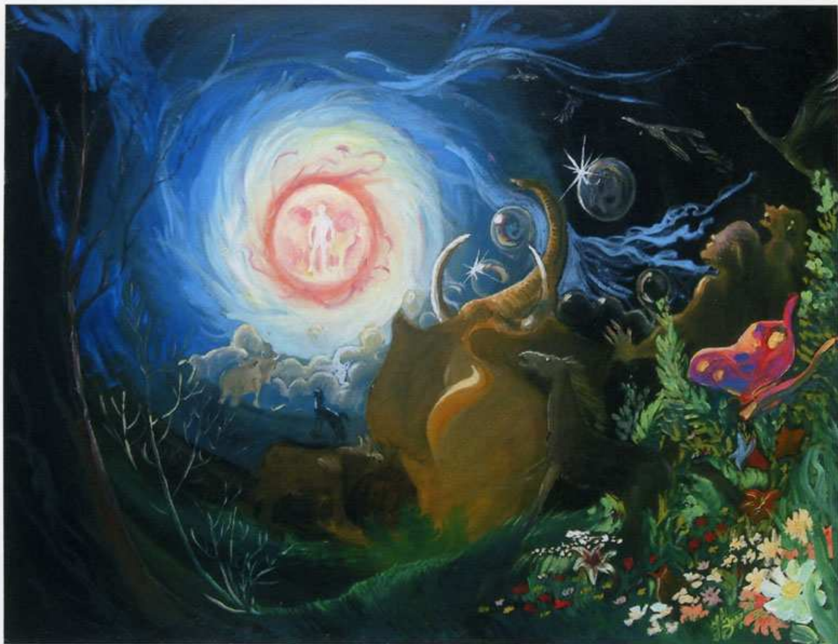
-1985 - "Presagio" Olio su tela (80x60)