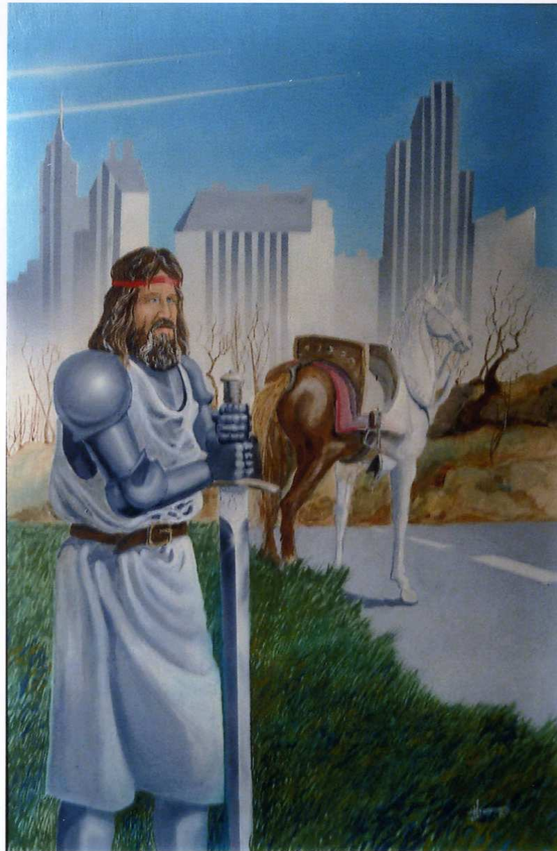
-1987 - "Parcifal" Tecnica mista su tela (60x90)

Ideali: null'altro che semi piantati nei solchi della vita, Il cui raccolto sarà un pugno di rimpianti.