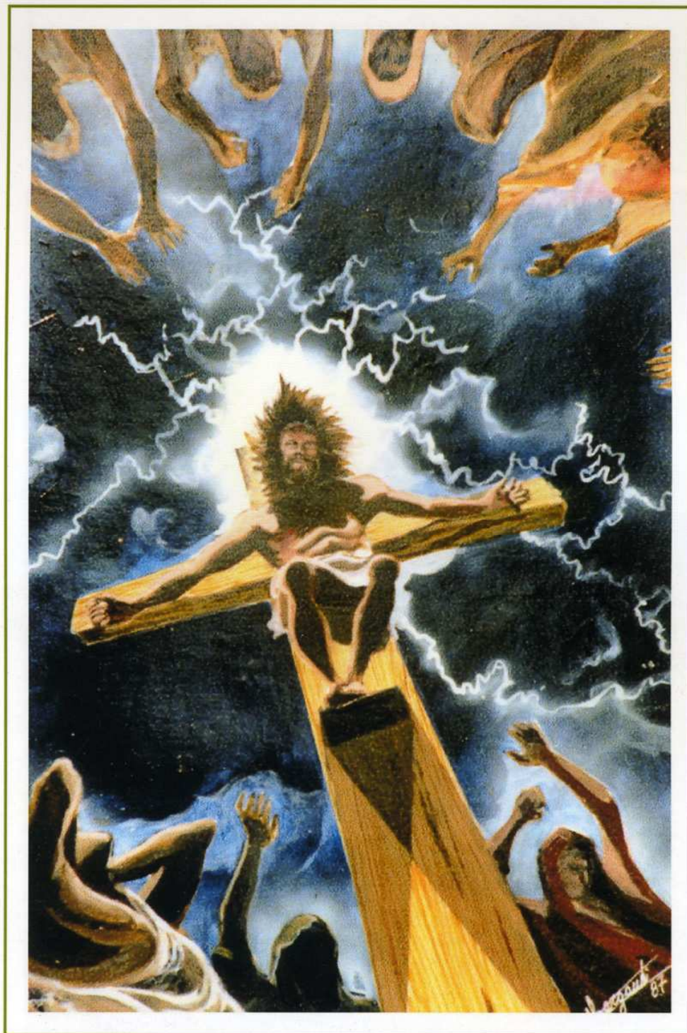
-1987 - "Golgota" Tecnica mista su cartone schoeller (30x40)