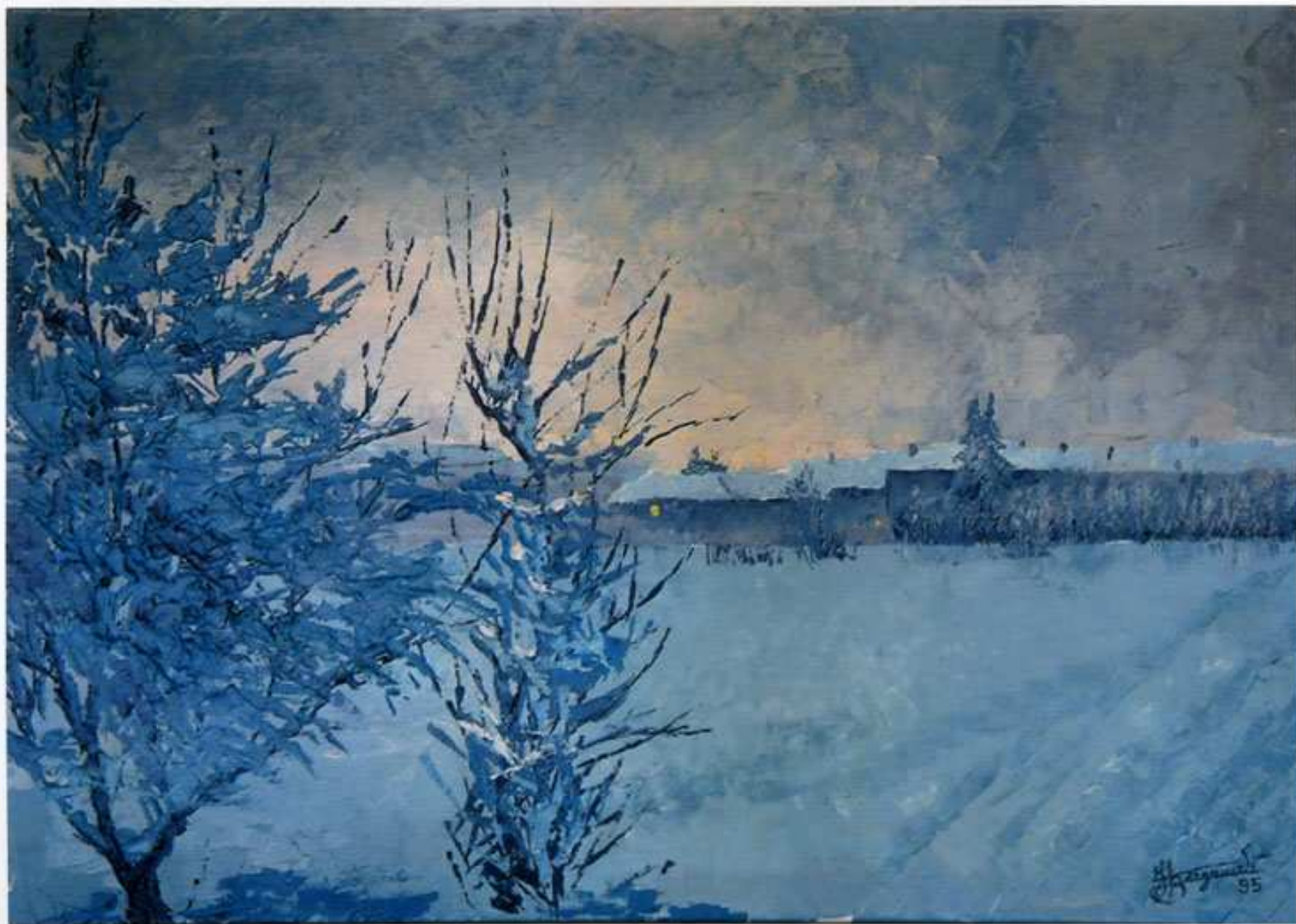
1995 "Il Risveglio" Acrilico spatolato su tela (80x60)