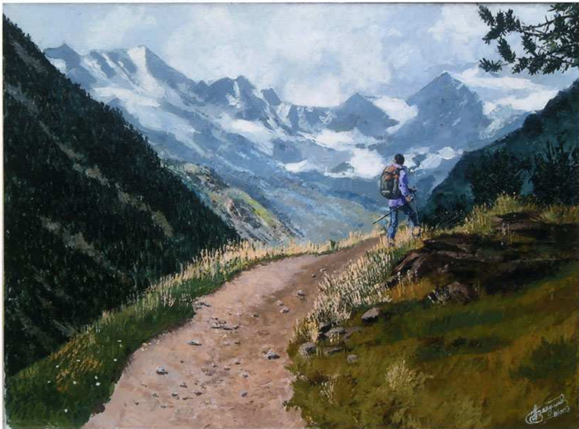
2003 “verso il paradiso” (80x60)