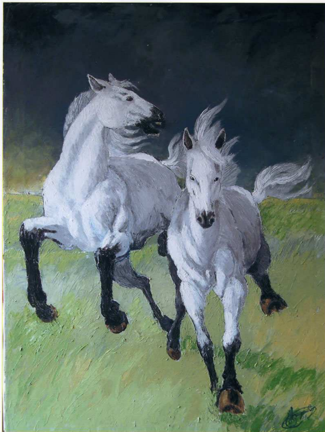
2008 "Ghiaccio e fiocco di neve" Acrilico spatolato su tela (60x80)