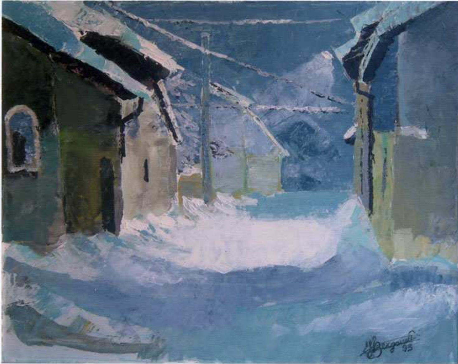
1995 “nevica in Via A. Boero” acrilico spatolato su tela (60x50)