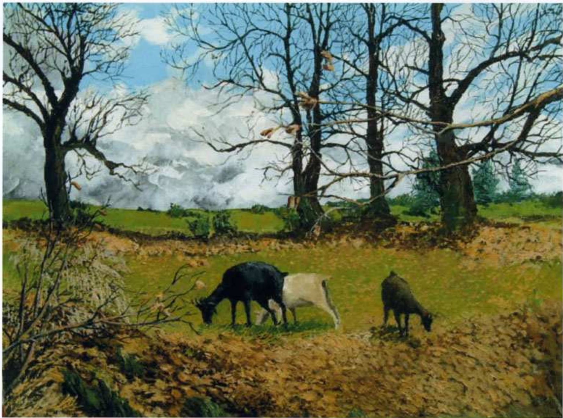
2003 "Capre e castagni" Acrilico spatolato su tela (60x50)