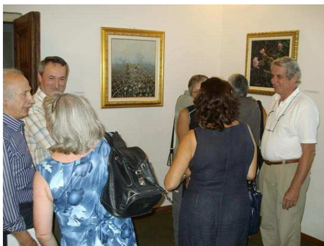
A destra, artisti e visitatori mescolati a passeggio tra le opere esposte

dalla preziosa appartenenza alla stessa terra: il Canavese. Un evento che ha visto gli artisti partecipare con entusiasmo e, cosa di non poco conto, mettersi in gioco rimanendo lontani anni luce dal malsano spirito di competizione che si respira ancora in troppi ambienti legati al mondo dell'arte. Una soddisfazione che mi piace sottolineare, al momento di ringraziare personalmente uno ad uno coloro che hanno deciso di affidare alle cure di "IMMAGINE ARTE" la promozione della propria attività artistica.