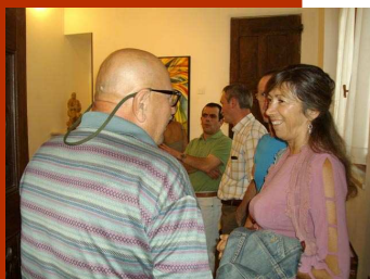
In alto, l'inaugurazione della collettiva

dalla preziosa appartenenza alla stessa terra: il Canavese. Un evento che ha visto gli artisti partecipare con entusiasmo e, cosa di non poco conto, mettersi in gioco rimanendo lontani anni luce dal malsano spirito di competizione che si respira ancora in troppi ambienti legati al mondo dell'arte. Una soddisfazione che mi piace sottolineare, al momento di ringraziare personalmente uno ad uno coloro che hanno deciso di affidare alle cure di "IMMAGINE ARTE" la promozione della propria attività artistica.