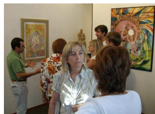
Un momento dell'inaugurazione della collettiva "Canavese in mostra"

ne, quindi, aver avuto sabato 5 settembre