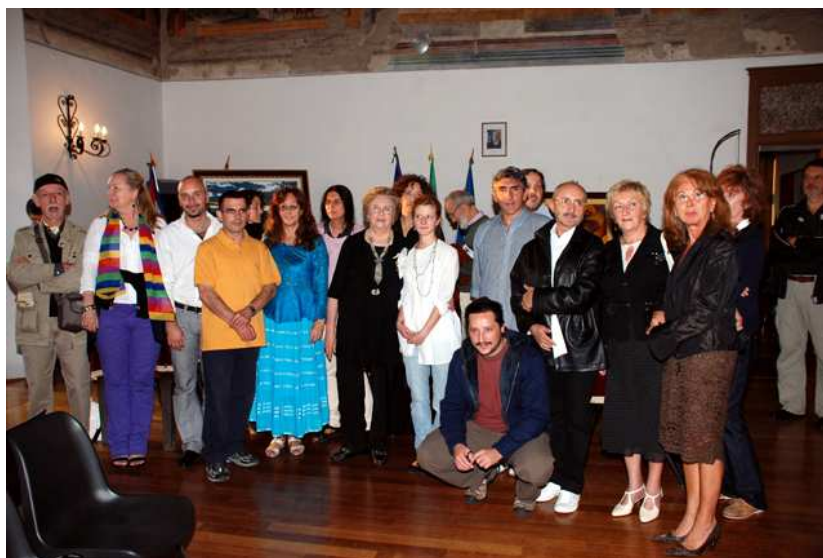
Gli artisti in posa per una foto di gruppo

riscosso l'interesse degli stessi artisti ma anche del folto pubblico che ha presenziato alla cerimonia di inaugurazione e alla giornata espositiva di domenica 11 ottobre.